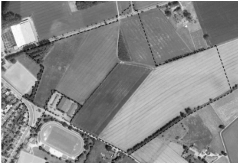
Abb. 1: Luftbildaufnahme März 1999 o. M.

Zur Zeit werden die Flächen des Bebauungsplanes überwiegend landwirtschaftlich (Acker- und Wiesenflächen) genutzt. Gebäude sind innerhalb des Plangebietes nicht vorhanden. Im Nordwesten des Plangebietes befindet sich auf einer Fläche von ca. 3.400 m 2 ein kleiner Wald, dessen Bewuchs überwiegend aus Pappeln besteht. Im nordöstlichen Bereich liegt ein weiterer kleiner Wald, Größe ca. 3.100 m 2 , dessen Bepflanzung aus jungen Laubgehölzen und Laubbäumen besteht. Zwischen diesem Wald und dem südlich des Plangebietes liegenden Hallenbad verläuft eine rund 200 m lange Wallhecke. Weiterer nennenswerter Bewuchs ist innerhalb des Plangebietes nicht vorhanden.