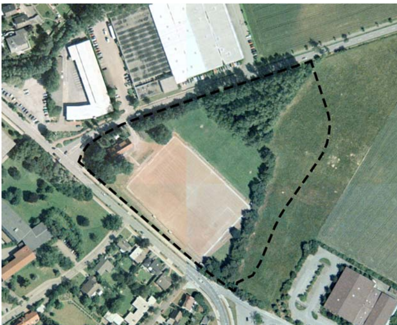
Abb. 1: Luftbildaufnahme Sommer 2000 o. M.

Bebauung des ehemaligen Sportplatzes Moorwiese zurückgestellt.