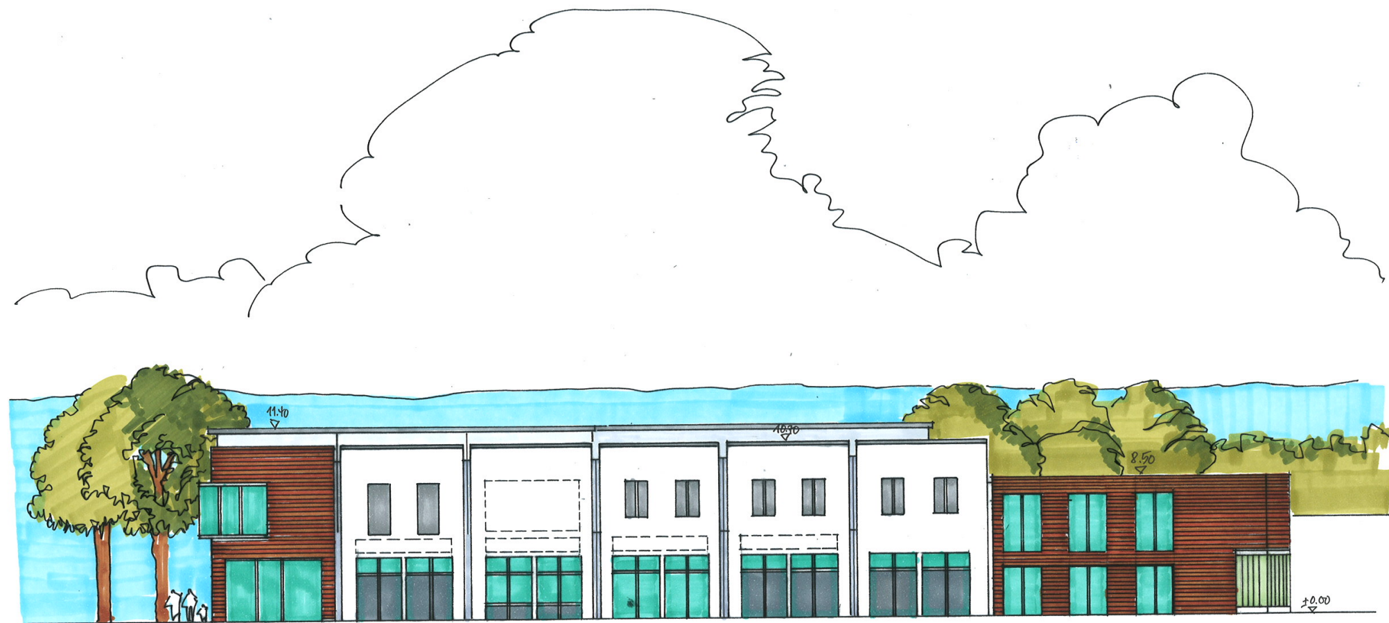
Geschäftshaus Ansicht Lange Straße