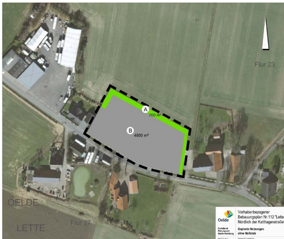
Übersichtsplan Geplante Nutzungen im Bereich des Bebauungsplans Nr. 112

Die Lage der einzelnen Flächen ist auch dem nachfolgenden Übersichtsplan „Geplante Nutzungen im Bereich des Bebauungsplans Nr. 112“ zu entnehmen: