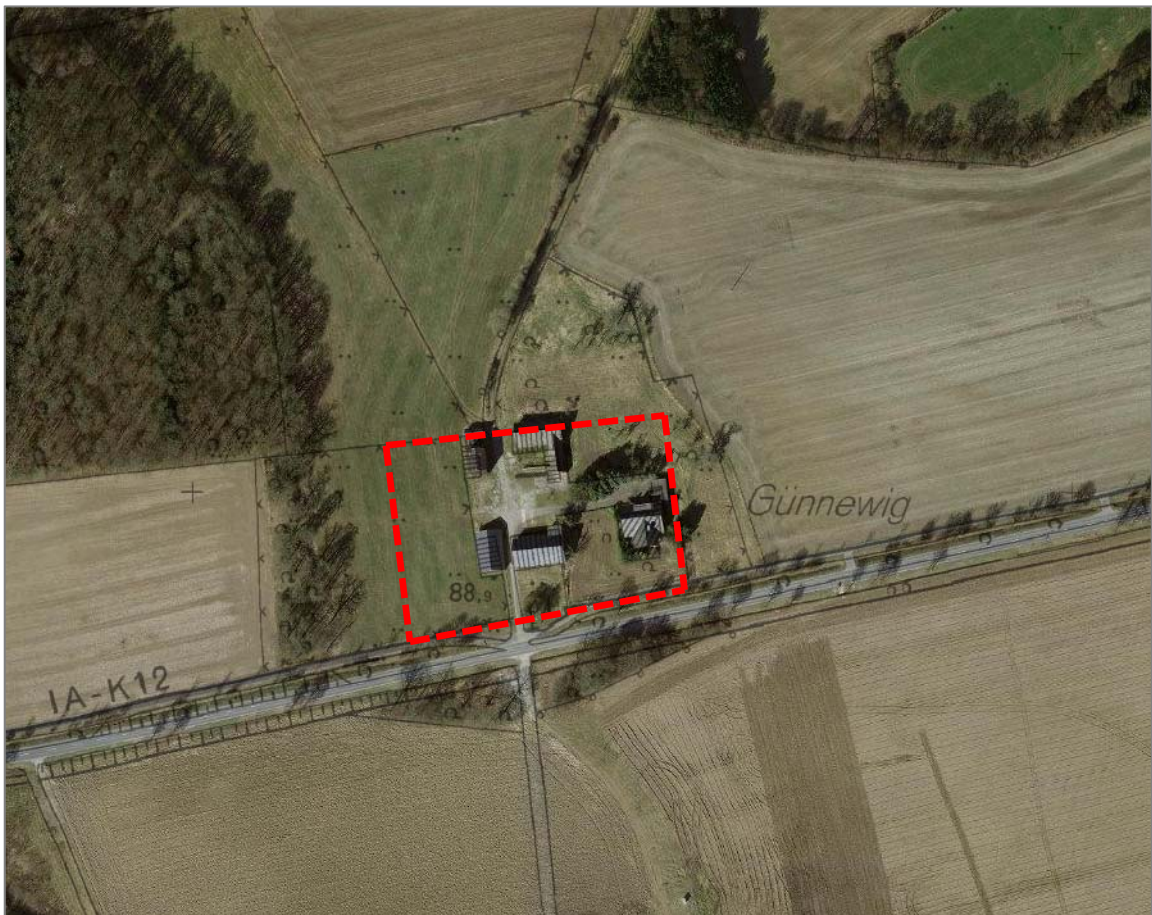
Abb. 1 Lage und Biotopstruktur des Planungsgebietes

Das Plangebiet liegt am Rand einer vom Landesamt für Natur, Umwelt und Verbraucherschutz (LANUV) Nordrhein-Westfalen abgegrenzten Biotopverbundfläche mit der Bezeichnung „Grünlandkomplexe und Wälder bei Stromberg“ (Objektkennung VB-MS-4115-001). Die Verbundfläche umfasst insgesamt ca. 773 ha und hat nach der Bewertung des LANUV eine besondere Bedeutung im landesweiten Biotopverbund (vgl. LANUV 2013).