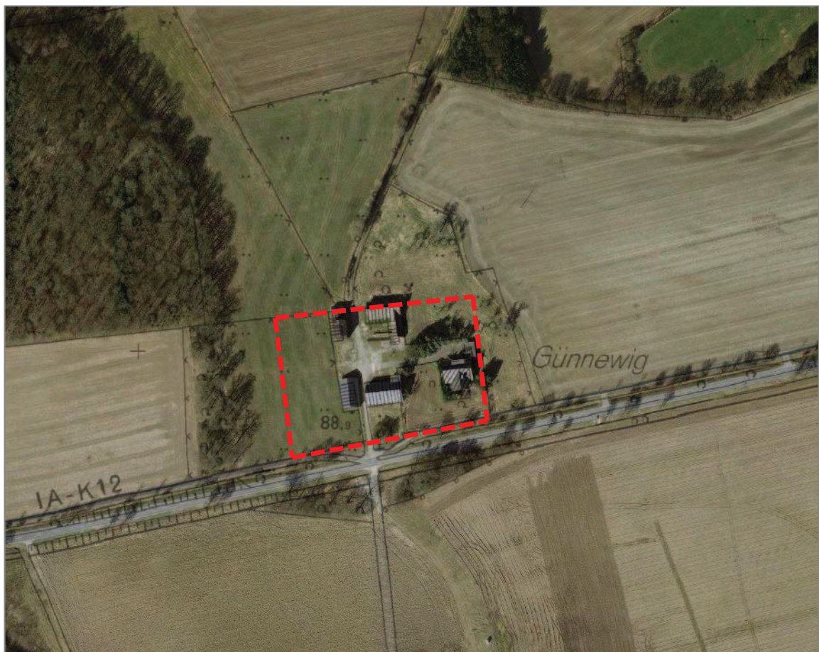
Abb. 1 Lage und Biotopstruktur des Planungsgebietes

Das Plangebiet liegt am Rand einer vom Landesamt für Natur, Umwelt und Verbraucherschutz (LANUV) Nordrhein-Westfalen abgegrenzten Biotopverbundfläche mit der Bezeichnung „Grünlandkomplexe und Wälder bei Stromberg“ (Objektkennung VB-MS-4115-001). Die Verbundfläche umfasst insgesamt ca. 773 ha und hat nach der Bewertung des LANUV eine besondere Bedeutung im landesweiten Biotopverbund (vgl. LANUV 2013).