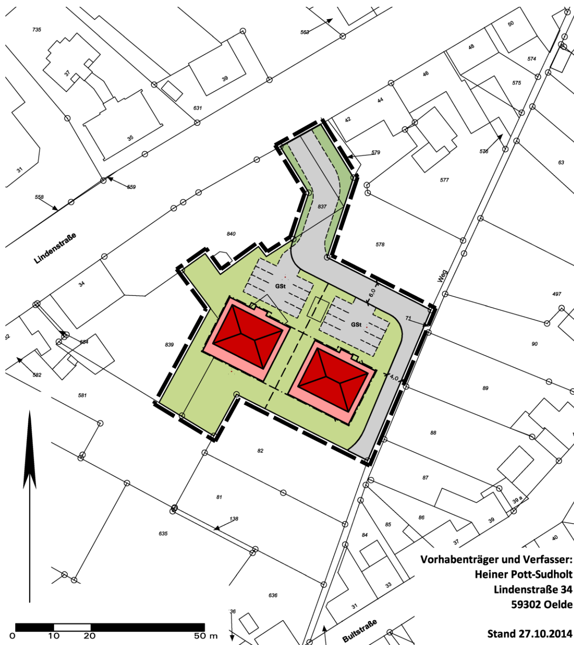
Lageplan der Vorhabenplanung, Stand Oktober 2014, unmaßstäblich

Vorhabenträger und Eigentümer der überplanten Grundstücksflächen ist Heiner Pott-Sudholt aus Oelde.