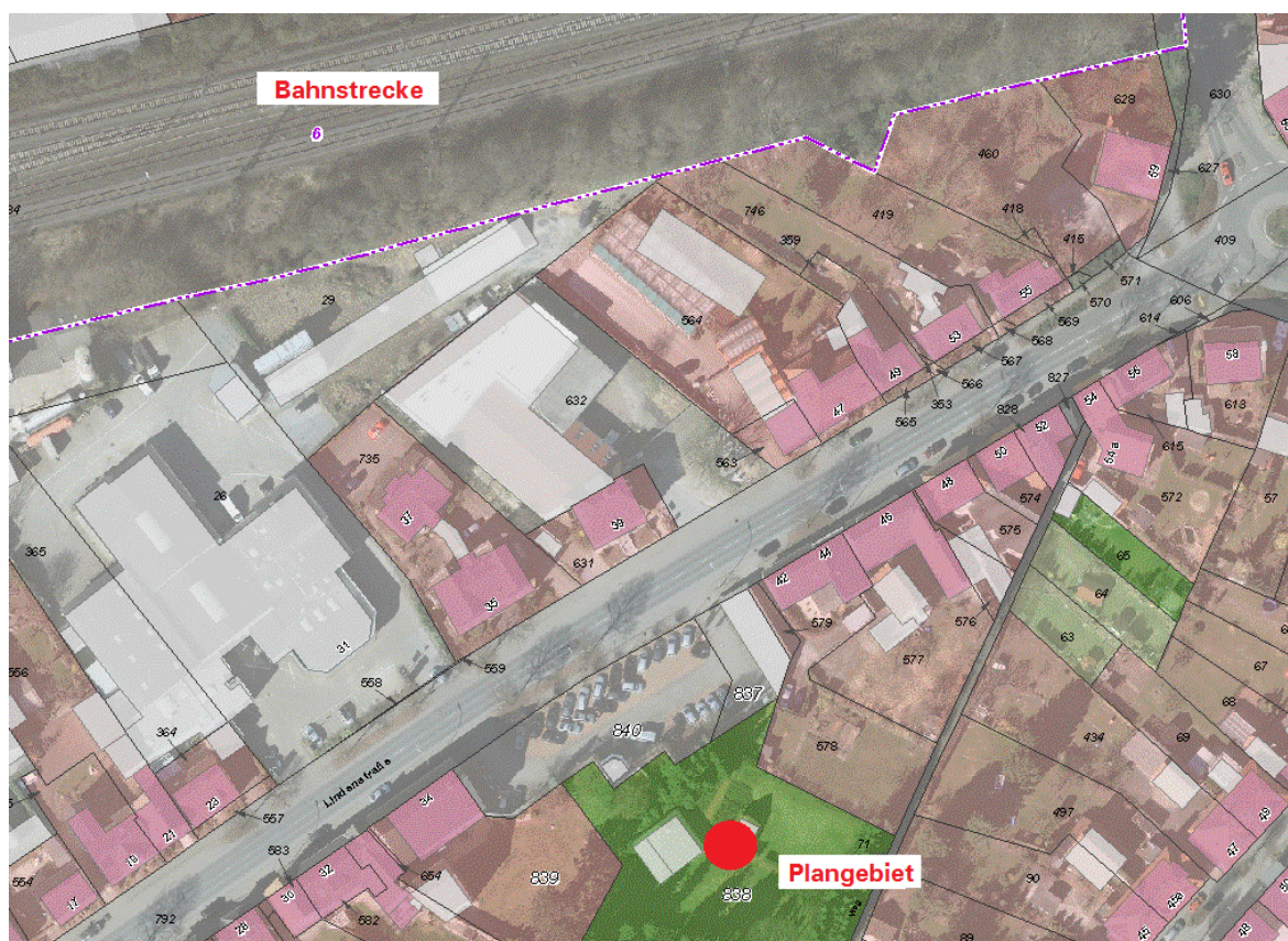
Kartenausschnitt mit Wohnnutzungen (rosa) und gewerblichen Nutzungen (hellgrau) sowie die Bahnstrecke am oberen Bildrand (Norden); ohne Maßstab

Da sich die Bahnlinie im Norden des Plangebiets befindet und die neuen Wohngebäude entsprechend der Anordnung der im vorhabenbezogenen Bebauungsplan festgesetzten überbaubaren Grundstücksflächen nach Südwesten ausgerichtet sind, ergibt sich auch für die Hauptwohnseiten eine Ausrichtung nach Südwesten. Zum einen werden hierdurch die Wohninnenräume und sich anschließende Terrassenbereiche zur Sonne ausgerichtet. Im vorliegenden Fall bewirkt dies gleichzeitig das Wegdrehen der besonders zu schützenden Gebäudeseiten von der Schallquelle und hierdurch eine gewisse Abschirmung der Terrassenbereiche durch das Gebäude als solches (Schallschatten). Darüber hinaus ist davon auszugehen, dass durch die Verwendung handelsüblicher Baumaterialien und Bauteile, deren Einbau sich automatisch durch die Anforderungen der Energieeinsparverordnung ergibt (EnEV 2014), Schalleinwirkungen maßgeblich reduziert werden.