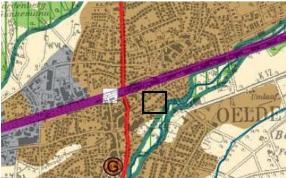
Ausschnitt des Regionalplans Münsterland mit Verortung des Bebauungsplangebiets (schwarzes Quadrat); Blatt 13; ohne Maßstab

Im Regionalplan Münsterland sind die Örtlichkeit sowie dessen nähere Umgebung als Allgemeiner Siedlungsbereich (ASB) dargestellt. In westlicher Richtung findet sich mit der bestehenden Warendorfer Straße, übergehend in die Konrad-Adenauer-Straße eine Verkehrsinfrastruktur der Hierarchiestufe Straße für den vorwiegend überregionalen und regionalen Verkehr .