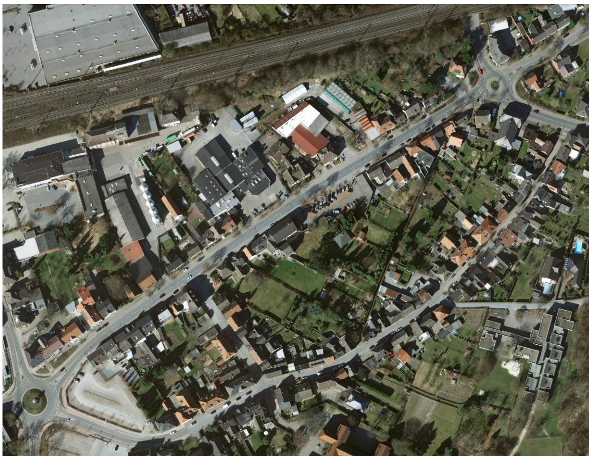
Luftbild; ohne Maßstab

Die Lindenstraße , die Straße Zur Axt , die Bultstraße und die Schmale Gasse bilden zusammen eine Art Ring. Bis auf eine Lücke von ca. 70 m an der Lindenstraße ist dieser Ring unmittelbar am Rand der öffentlichen Fläche eng mit Wohngebäuden bebaut. Auf den zahlreichen, lang gestreckten Grundstückspartellen schließen sich in zweiter Reihe zunächst verschiedene Hofsituationen und daran wiederum Gartenflächen an. Im zentralen Bereich ergeben sich im Zusammenwirken mit weiteren, bis heute unbebauten Grundstücken für eine innerstädtische Lage vergleichsweise großflächige, zumeist gärtnerisch genutzte Freiflächen mit einer Größe von insgesamt rund 1,4 ha.