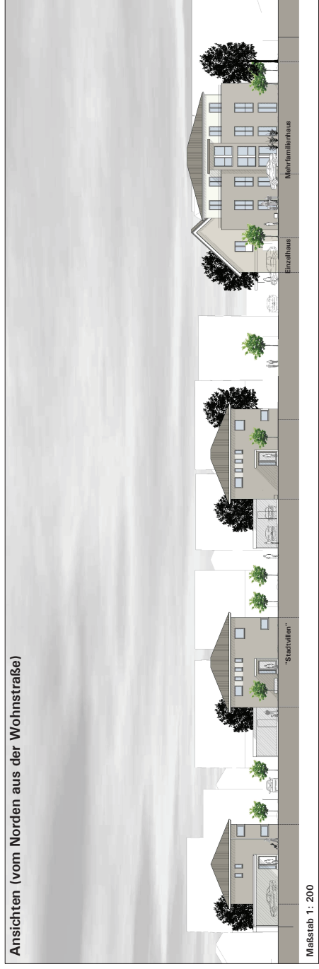
Maßstab 1: 200

STADT OELDE: VORHAEBENZEGENER BEBAUUNGSPLAN NR. 122 „NÖRDLICH DER FERDINAND-KRÜGER-STRASSE“ Vorhaben- und Erschließungsplan