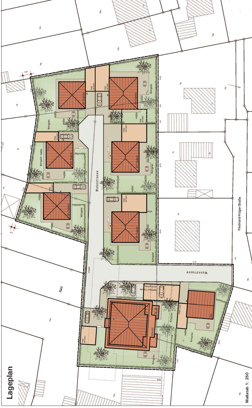
Maßstab 1: 250