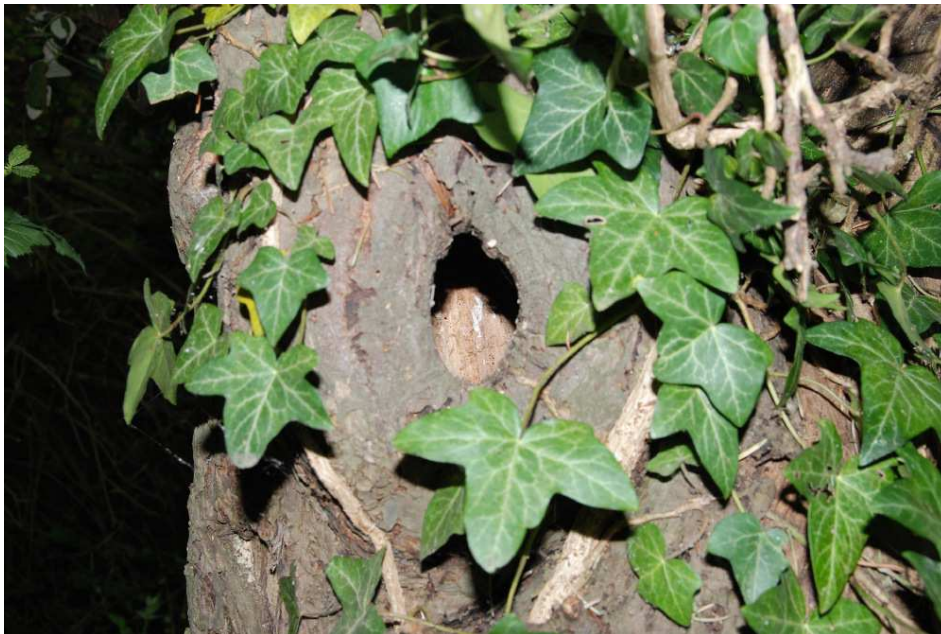
Foto 3: Die Höhlen in einem abgestorbenen Obstbaum sind als Quartiere für Fledermäuse grundsätzlich geeignet.