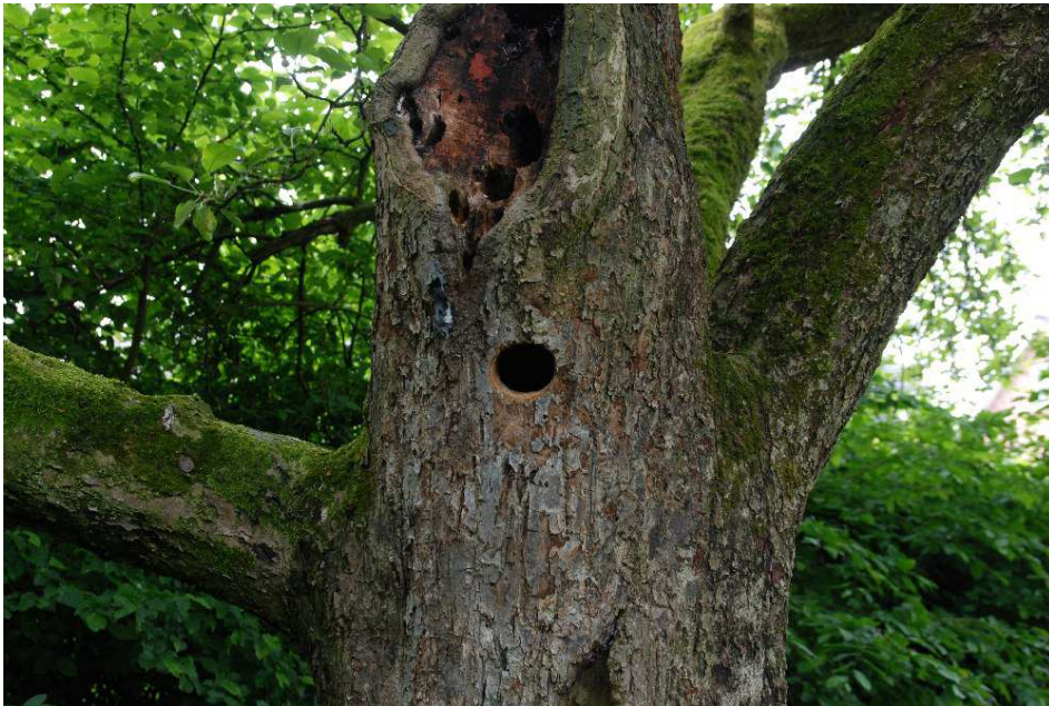
Foto 1: Apfelbaum mit besetzter Grünspechthöhle. Aus dem Inneren waren die bettelnden Küken zu hören.