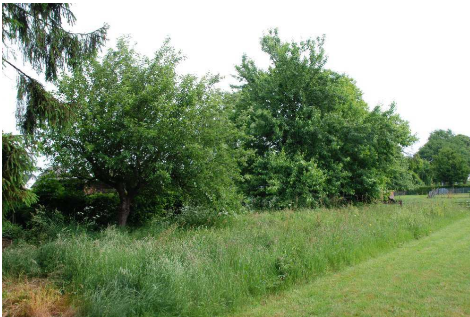
Foto 6: Gehölzbestand zwischen nördlichen und südlichen Parzellen.