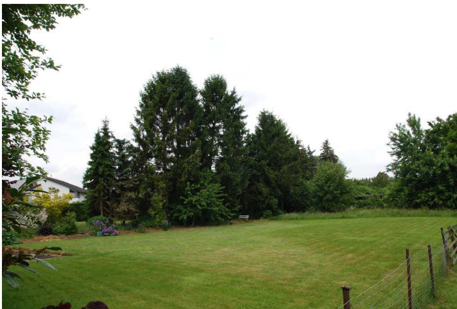
Foto 4: Parzelle 1094 mit Zierrassen und angrenzendem Baumbestand.