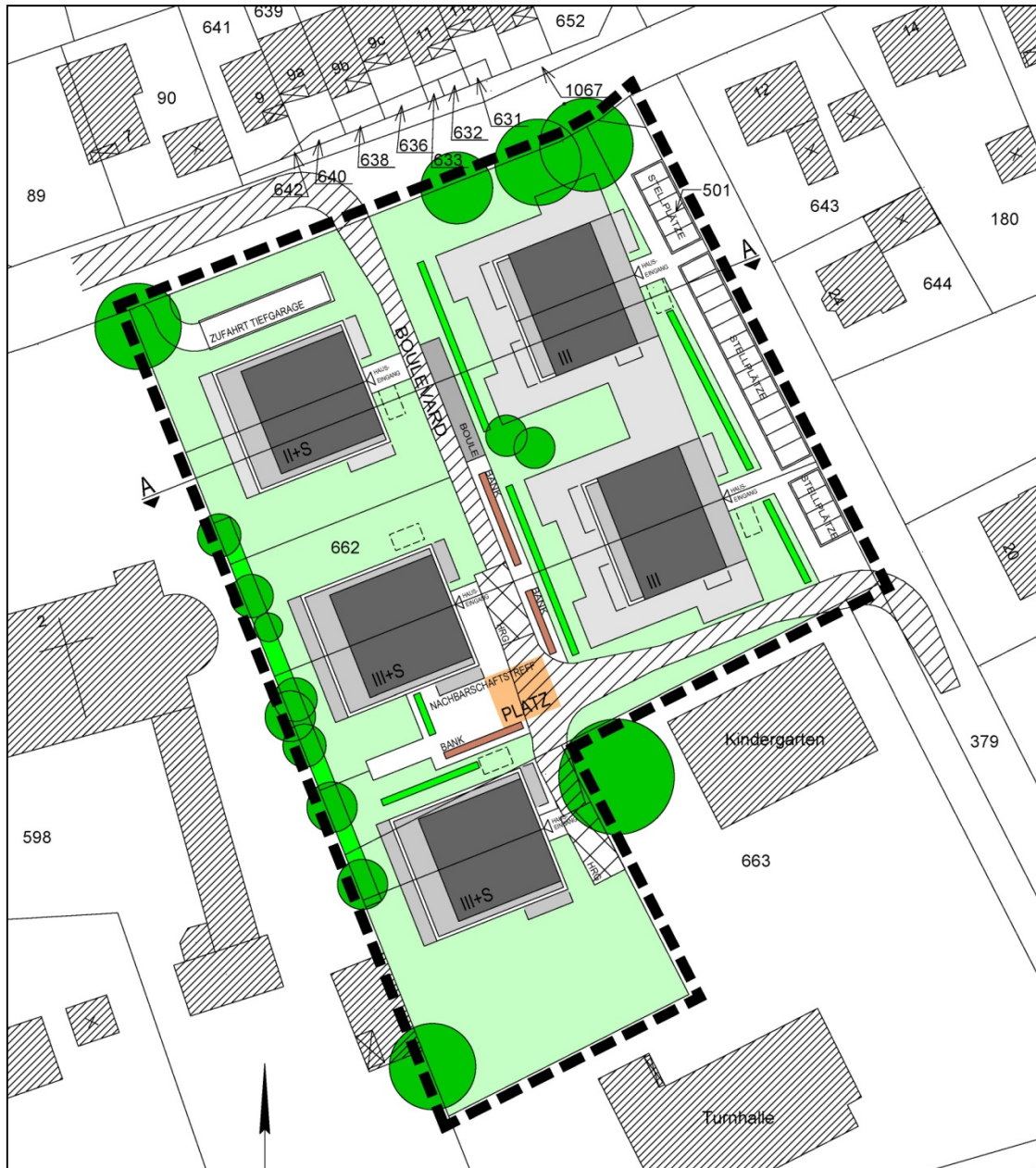
Abb. 2: Lageplan zum Vorhaben (Ausschnitt) /11/