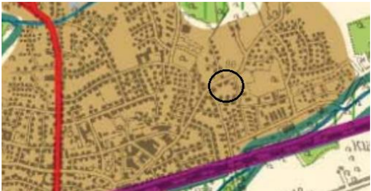
Ausschnitt des Regionalplans Münsterland, Blatt 13 (Stand 27.06.2014); genordet, ohne Maßstab

Der geltende Regionalplan Münsterland wurde am 16. Dezember 2013 vom Regionalrat Münster aufgestellt und am 27. Juni 2014 von der Landesplanungsbehörde Nordrhein-Westfalen bekannt gemacht. Im Regionalplan, Blatt 13 sind die Örtlichkeit sowie dessen nähere Umgebung als Allgemeiner Siedlungsbereich (ASB) dargestellt. In westlicher Richtung stellt die bestehende Warendorfer Straße eine Verkehrsinfrastruktur der Hierarchiestufe Straße für den vorwiegend überregionalen und regionalen Verkehr dar. Im Süden des Plangebiets befindet sich im Bereich der Bahnstrecke eine Kennzeichnung als Schienenwege für den Hochgeschwindigkeitsverkehr und sonstigen großräumigen Verkehr .