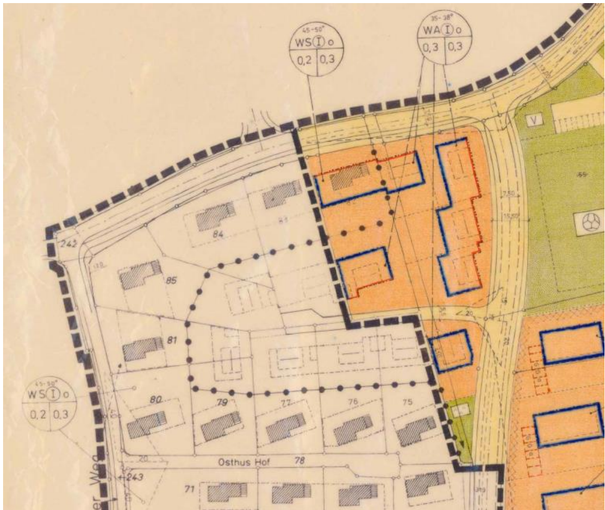
Ausschnitt aus 1. Änderung des Bebauungsplan Nr. 28 „Axthausen“; genordet, ohne Maßstab

stücksflächen nicht von der Straße Zum Sunden, sondern von der Straße „Zum Eichenbusch“.