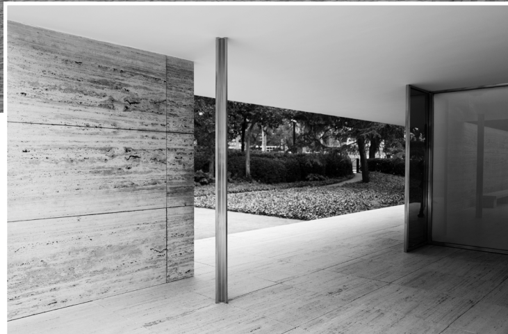
Barcelona-Pavillon, gebaut 1929 zur Weltausstellung