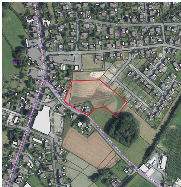
Luftbild mit Geltungsbereich, genordet, ohne Maßstab

Der Änderungsbereich liegt im Süden des Ortsteils Lette nördlich der „Katthagenstraße“ und umfasst die Flurstücke 250, 251, 471 und 635 in der Flur 23.