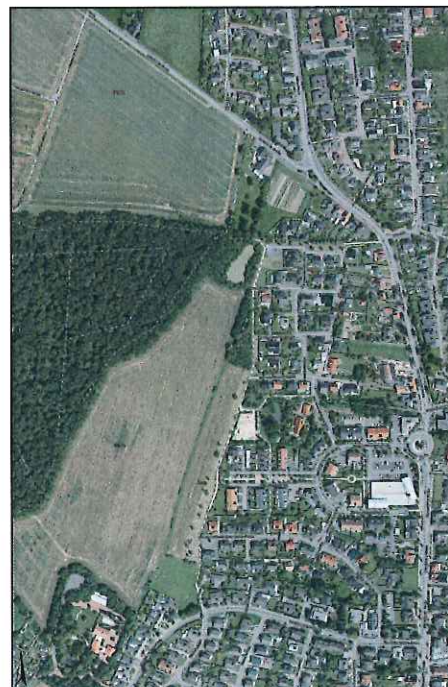
Luftbild 2014 KreisWarendorf

NEU: Vergrößerung des Plangebietes BISHER: 7,8ha. NEU: 8,3ha.