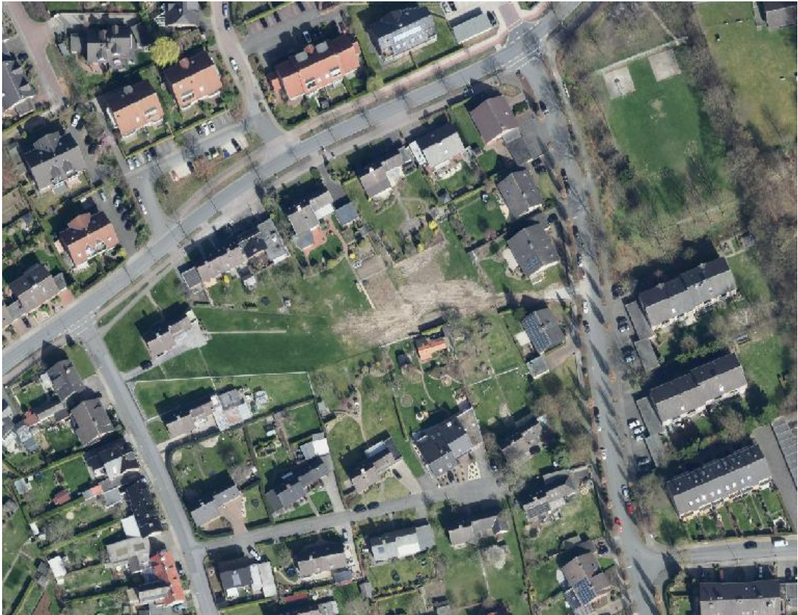
Luftbild; genordet, ohne Maßstab