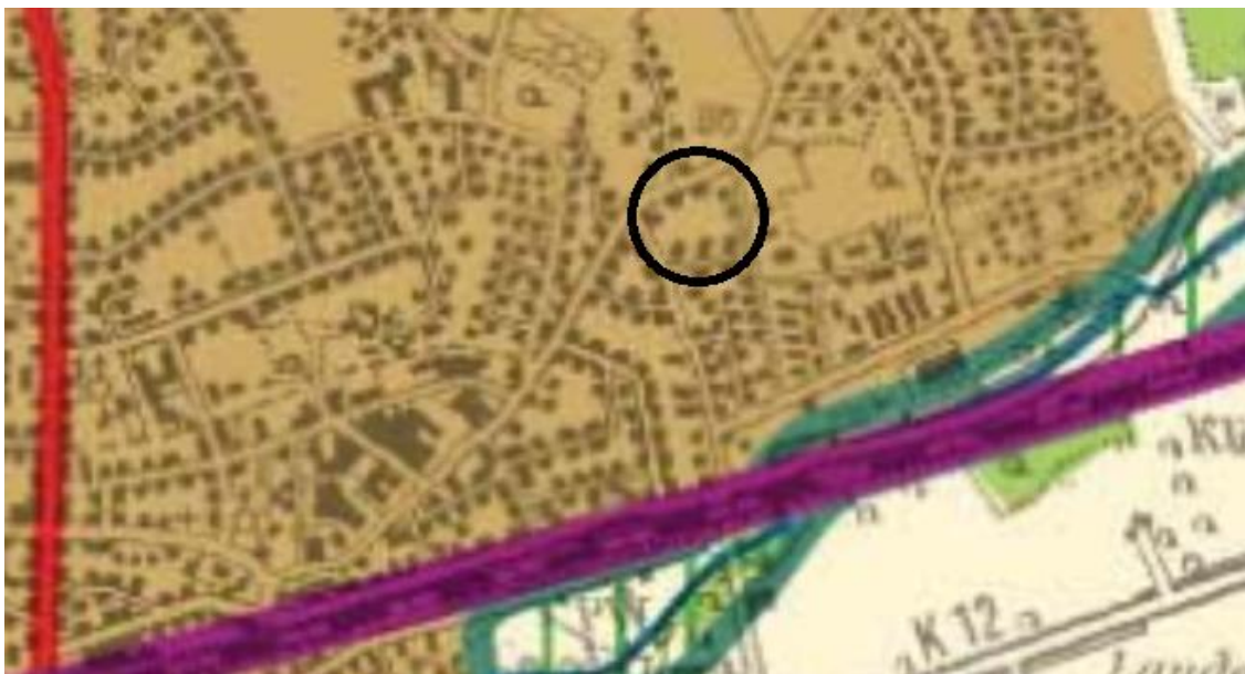
Ausschnitt des Regionalplans Münsterland, Blatt 13 (Stand 27.06.2014); genordet, ohne Maßstab

Der geltende Regionalplan Münsterland wurde am 16. Dezember 2013 vom Regionalrat Münster aufgestellt und am 27. Juni 2014 von der Landesplanungsbehörde Nordrhein-Westfalen bekannt gemacht. Im Regionalplan, Blatt 13 sind die Örtlichkeit sowie dessen nähere Umgebung als Allgemeiner Siedlungsbereich (ASB) dargestellt. Der Regionalplan Münsterland benennt in Bezug auf ASB folgende übergreifende abwägbare Grundsätze der Raumordnung: Grundsatz 8: Allgemeine Siedlungsbereiche kompakt entwickeln! und Grundsatz 9: Allgemeine Siedlungsbereiche – wo möglich – bedarfsorientiert aktualisieren! Als Ziel der Raumordnung formuliert der Regionalplan in Bezug auf ASB und als Konkretisierung des Grundsatzes 8 das abschließend abgewogene Ziel 3: Allgemeine Siedlungsbereiche bedarfsgerecht in Anspruch nehmen!