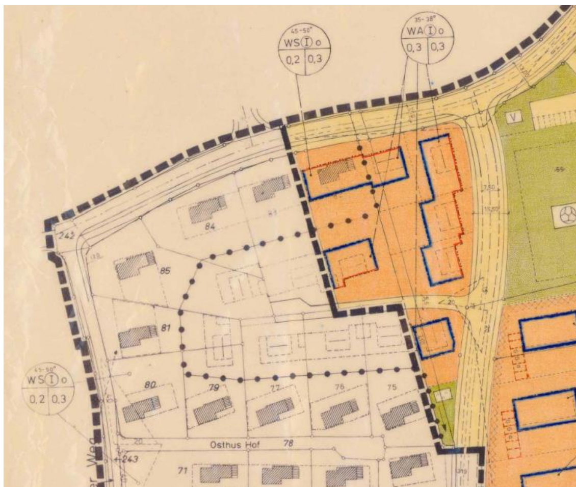
Ausschnitt aus 1. Änderung des Bebauungsplans Nr. 28 „Axthausen“; genordet, ohne Maßstab

Allgemeines Wohngebiet aus. Ein Teilbereich im nordwestlichen Eckbereich, in dem sich der hier zu betrachtende vorhabenbezogene Bebauungsplan 126 und die Erweiterungsfläche befinden, ist als Kleinsiedlungsgebiet ausgewiesen. In einer 1. Änderung des Plans Nr. 28 im Jahre 1981 erfolgte u. a. eine Neuordnung im Einmündungsbereich „Zum Sundern/Zum Eichenbusch“ sowie eine Anbindungsmöglichkeit rückwärtiger Grundstücksflächen nicht von der Straße „Zum Sundern“, sondern von der Straße „Zum Eichenbusch“.