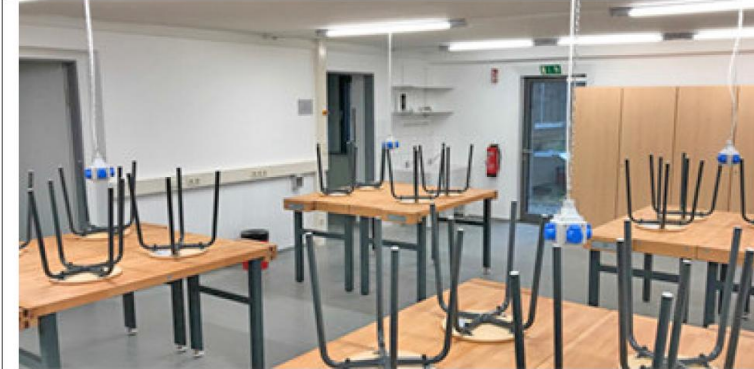
Sanierung Technikraum II (ehem. EDV-Raum Realschule)