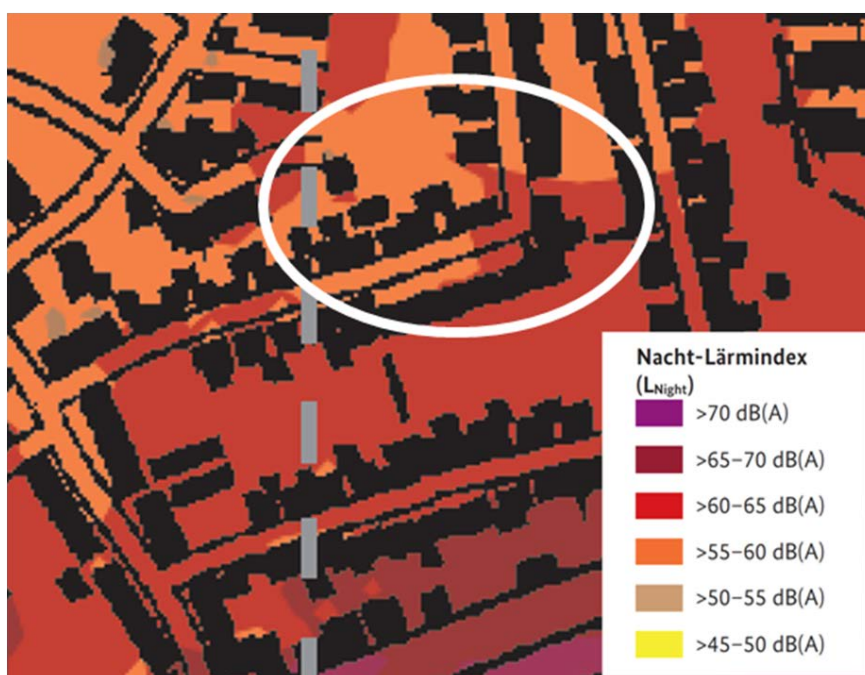
Isophonenbänder „Nacht“ (L NIGHT = von 22:00 Uhr bis 6:00 Uhr über das ganze Jahr gemittelter Dauerschallpegel); Plan genordet ohne Maßstab; Lage der 1. vereinfachten Änderung des Bebauungsplans Nr. 127 schematisch ergänzt durch weißen Kreis