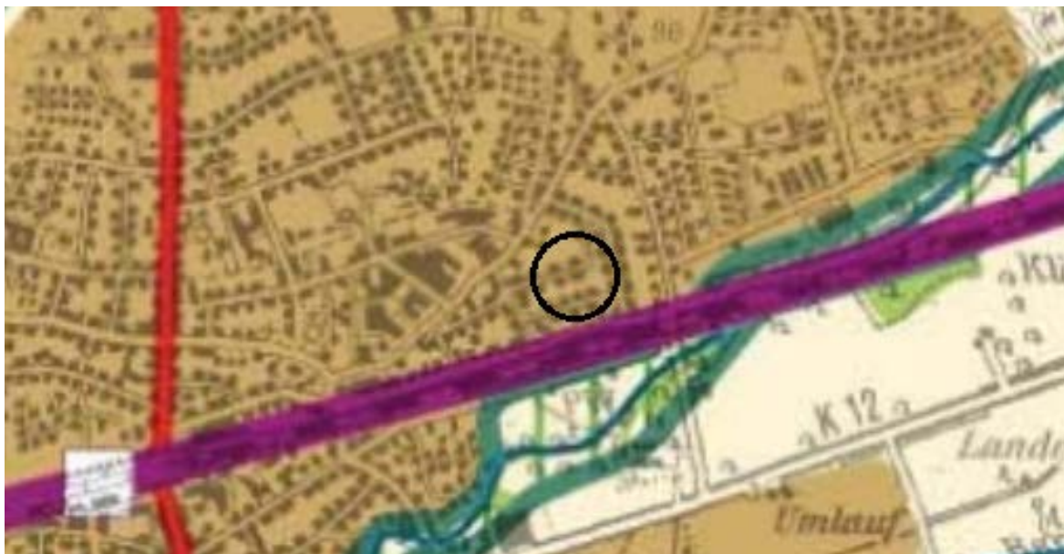
Ausschnitt des Regionalplans Münsterland, Blatt 13 (Stand 27.06.2014); genordet, ohne Maßstab

Quelle: Bezirksregierung Münster, Geoportal, Internetabfrage am 05.02.2018