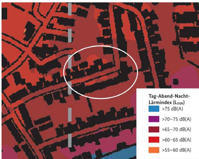
Isophonenbänder „Tag-Abend-Nacht“ (L DEN = über alle 24-stündigen Tage des Jahres gemittelter Dauerschallpegel); Plan genordet ohne Maßstab; Lage der 1. vereinfachten Änderung des Bebauungsplans Nr. 127 schematisch ergänzt durch weißen Kreis