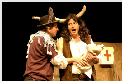
Ox und Esel Do. 29. November