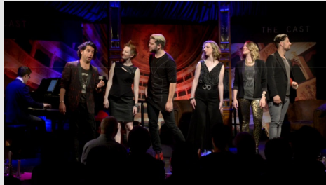
The Cast Do. 11. Oktober