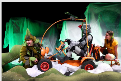
Robbi, Tobbi & das Fliewatüt Do. 18. Oktober