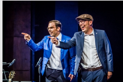
Baumann & Clausen Sa. 10. November

- Absage der Veranstaltung wegen zu geringer Nachfrage -