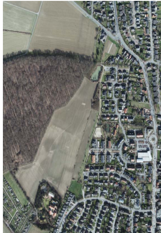
Abbildung 1: Luftbild 2018, Kreis Warendorf

Derzeit werden erste Arbeiten durchgeführt, um zeitnah auf Grundlage des bestehenden Bebauungsplanes Nr. 131 mit der Bebauung der Flächen beginnen zu können. Der Satzungsbeschluss für die 1. Vereinfachte Änderung soll vor Beginn der Errichtung der Gebäude gefasst werden.