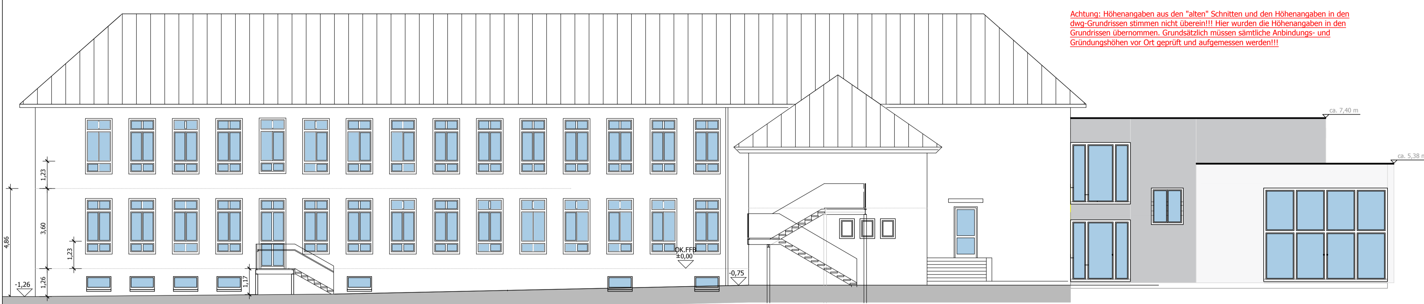
Ansicht Osten, Schulhofseite

LEGENDE : Alle Masse sind durch den Auftragnehmer eigenverantwortlich zu nehmen und zu prüfen. Für Massfehler und deren Folgen haftet allein der Auftragnehmer !