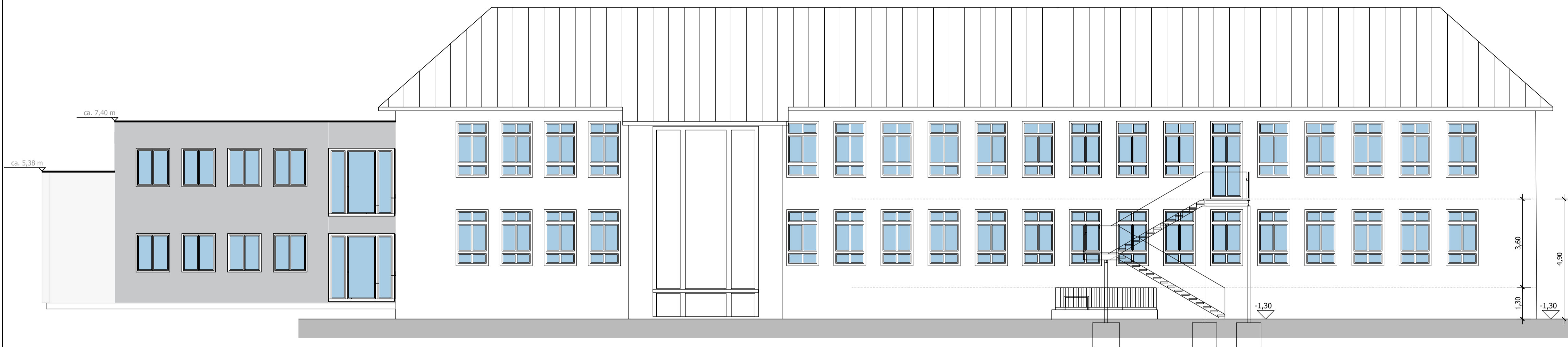
Ansicht Westen, Rückseite