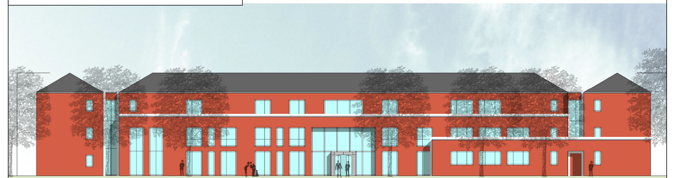
ANSICHT NORDEN - ENNIGERLOHER STRASSE