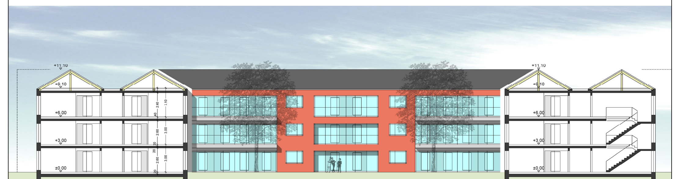
SCHNITT A - A