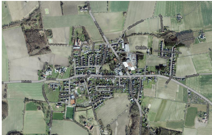
Abbildung 1: Luftbild Sünninghausen mit Plangebiet im Süden

Von dem Bebauungsplan Nr. 140 „Parkplatz Friedhof Sünninghausen“ werden die Flurstück 133 tlw. und 40 tlw. des Flures 308 der Gemarkung Oelde erfasst.