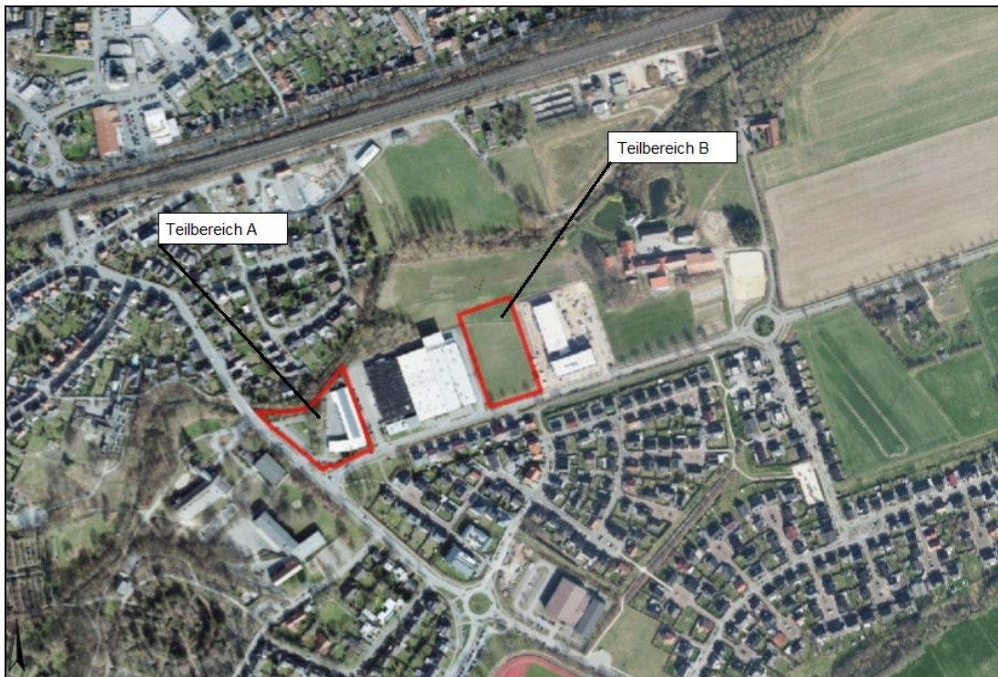
Abbildung 1: Lage des Plangebietes