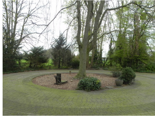
Abb. 7 Hänge-Buche im Hinterhof des Hotels Hartmann, südlich des Plangebiets.