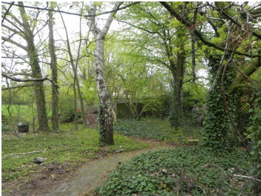
Abb. 8 Gehölzbestand, der südlich an das Plangebiet angrenzt.