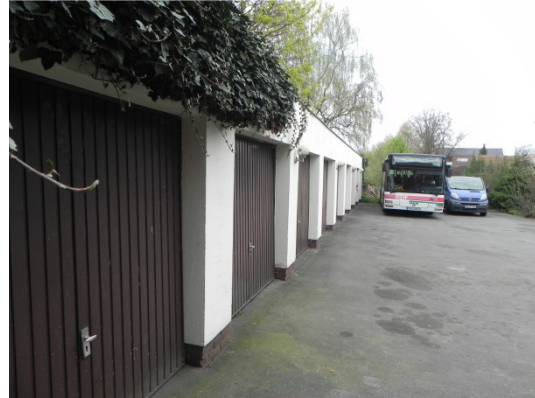
Abb. 13 Zum Abbruch vorgesehene Garagenreihe.