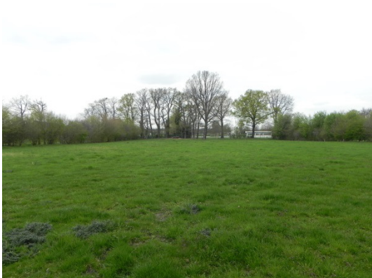
Abb. 4 Blick von Süden über das Grünland im Plangebiet.

Lebensraumtypen: Fettwiesen und -weiden Äcker