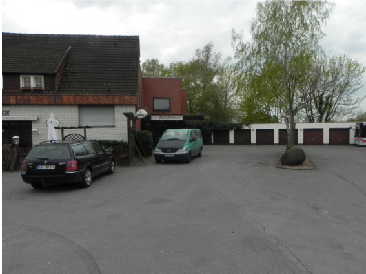
Abb. 12 Blick von der „Hauptstraße“ auf das Plangebiet. Links im Bild das Hotel Hartmann.