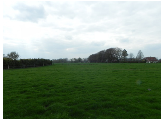
Abb. 5 Westlich angrenzendes Grünland und Ackerfläche.