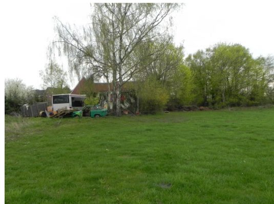
Abb. 11 Blick auf die Gehölze hinter der Garagenreihe sowie den südlich an das Plangebiet grenzenden Gehölzbestand.