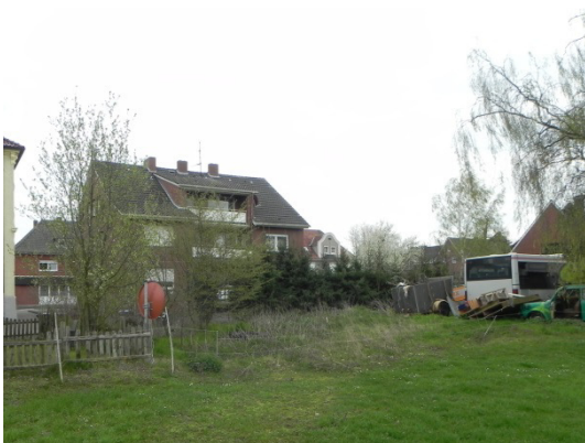
Abb. 16 Brachfläche im Osten des Plangebiets.