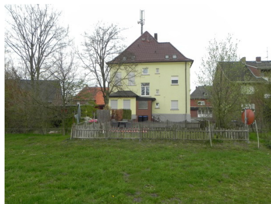
Abb. 15 Wohnhaus östlich des Plangebiets. Der dazugehörige Garten liegt innerhalb des Geltungsbereichs des Bebauungsplans.