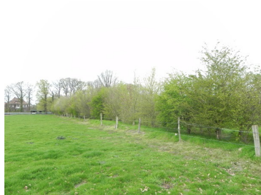
Abb. 9 Strauchhecke entlang der westlichen Plangebietsgrenze.