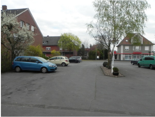
Abb. 6 Birke im östlichen Plangebietsbereich. Blick auf die angrenzende „Hauptstraße“.