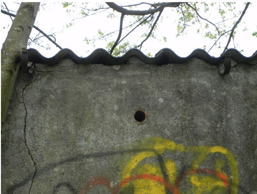
Abb. 18 Einflugmöglichkeiten für Fledermäuse an dem Garagengebäude.

Die Garagenreihe im Plangebiet und die Gebäude der angrenzenden Siedlungsbereiche sind generell geeignet, gebäudebewohnenden Tierarten eine Quartiermöglichkeit zu bieten. An dem Gebäude im Plangebiet sowie an angrenzenden Gebäudefassaden und -dächern wurden keine Nisthabitate von Vogelarten festgestellt.