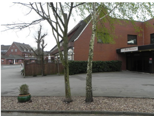
Abb. 19 Ahorn mit Höhlung im Osten des Plangebiets.

Ein Ahorn im Bereich des Parkplatzes im Osten des Plangebiets wies eine auffällige Höhlung in ca. 2 m Stammhöhe auf. Diese wurde während der Ortsbegehung kontrolliert. Es konnte kein Besatz durch Fledermäuse festgestellt werden. Dennoch ist eine Eignung als Sommerquartier für Fledermäuse nicht sicher auszuschließen.