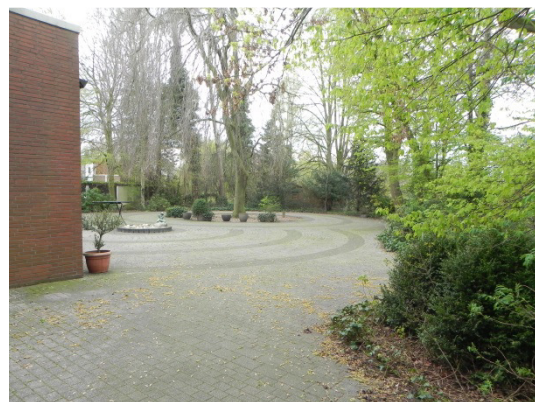
Abb. 17 Hinterhof des Hotels Hartmann südlich des Plangebiets.