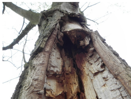
Abb. 20 Detailaufnahme der Höhlung.