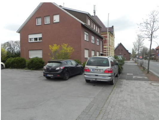
Abb. 14 Anschließende Wohnbebauung entlang der „Hauptstraße“. Blick Richtung Norden.