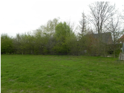
Abb. 10 Strauchhecke entlang der östlichen Plangebietsgrenze.