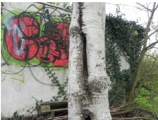
Abb. 21 Oberflächliche Höhle in einer Birke nördlich der Garage.