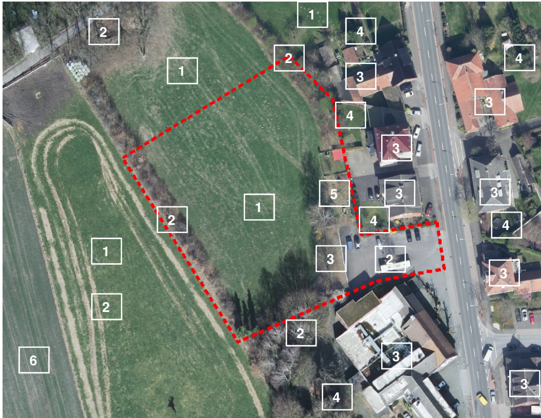
Abb. 3 Bestandssituation des Plangebietes (rote Markierung) auf Basis des Luftbildes.