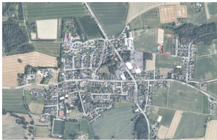
Abbildung 1: Lage des Plangebietes

Das Plangebiet liegt im Nordosten von Sünninghausen und umfasst etwa 1,5 ha. Die südliche Plangebietsgrenze verläuft entlang der Straße „Feldmark“, die östliche grenzt an das bestehende Baugebiet „Am Tienenbach“ an. Nördlich des Plangebietes verläuft der Tienenbach und es grenzen zum Teil bestehende Ausgleichsflächen der Stadt Oelde an. Im Westen wird das Plangebiet durch landwirtschaftlich genutzte Flächen begrenzt.