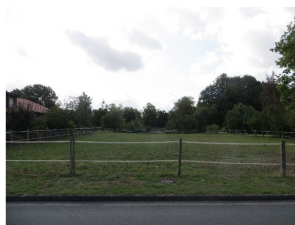
Wiesenfläche Blick von Norden