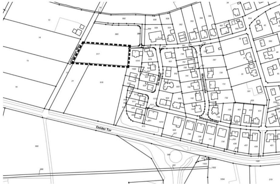
Abbildung 1: Übersicht, Geltungsbereich der 41. FNP-Änderung (unmaßstäblich)