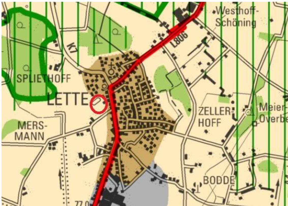
Abbildung 2: Auszug aus dem Regionalplan Münsterland

Die Umsetzung an anderer Stelle würde den Anforderungen der Nutzung nicht gleichermaßen gerecht, die Bedeutung des betroffenen Gebietes erlaubt den Eingriff und der Eingriff wird auf das nachweislich erforderliche Maß beschränkt. Die Beeinträchtigungen werden auf Ebene des parallel aufzustellenden Bebauungsplanes kompensiert. Die mit der Planung angestrebte Neunutzung einer bereits bebauten Fläche entspricht daher den hiermit verbundenen landes- und regionalplanerischen Zielvorgaben. Im Ergebnis bewertet die Stadt die vorliegende Planung daher als an die Ziele der Raumordnung gemäß § 1 (1) BauGB angepasst.