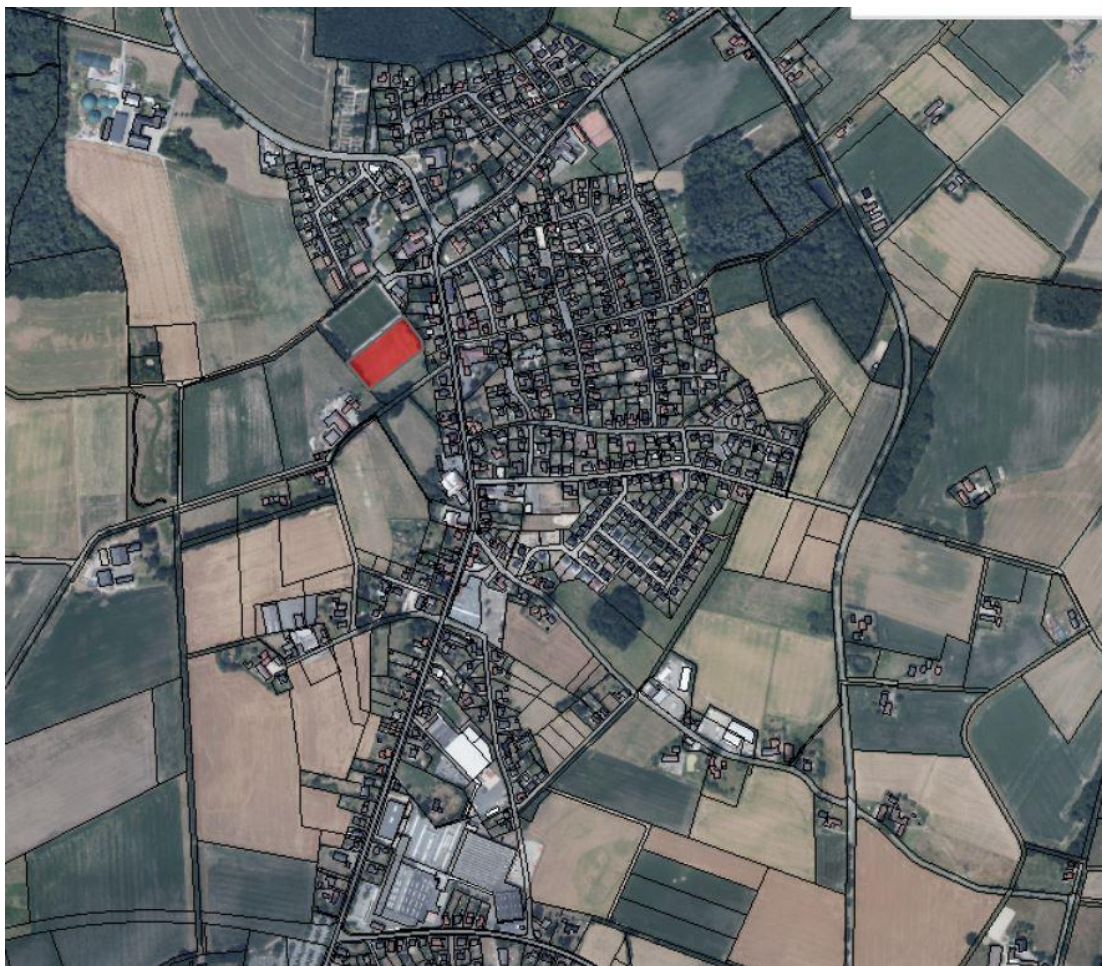
Abbildung 1: Lage des Plangebietes im Oelder Ortsteil Lette

Derzeit werden die Flächen der Flächennutzungsplanänderung bereits überwiegend zu Sportzwecken – Rasenfußballplatz – genutzt. Im Osten des Planbereiches befindet sich eine mit Strauchwerk bewachsene Fläche, welche erhalten bleiben soll. Das Umfeld wird durch wohnbauliche Gebäude, sportliche Anlagen und der Nähe zum landwirtschaftlich genutzten Außenbereich geprägt.