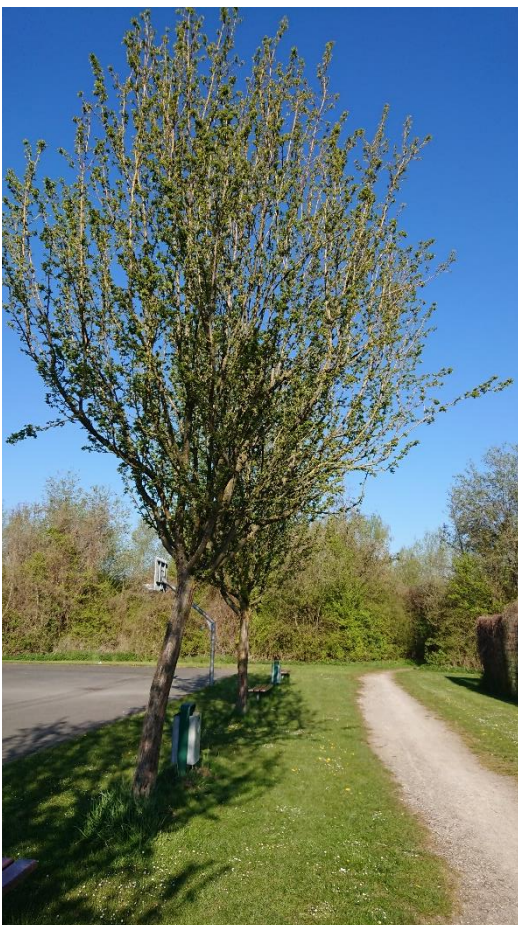
Foto 4: Fläche zwischen Basketball- und Bolzplatz mit Bänken, Abfalleimern und Weg (junge Weißdornbäume)