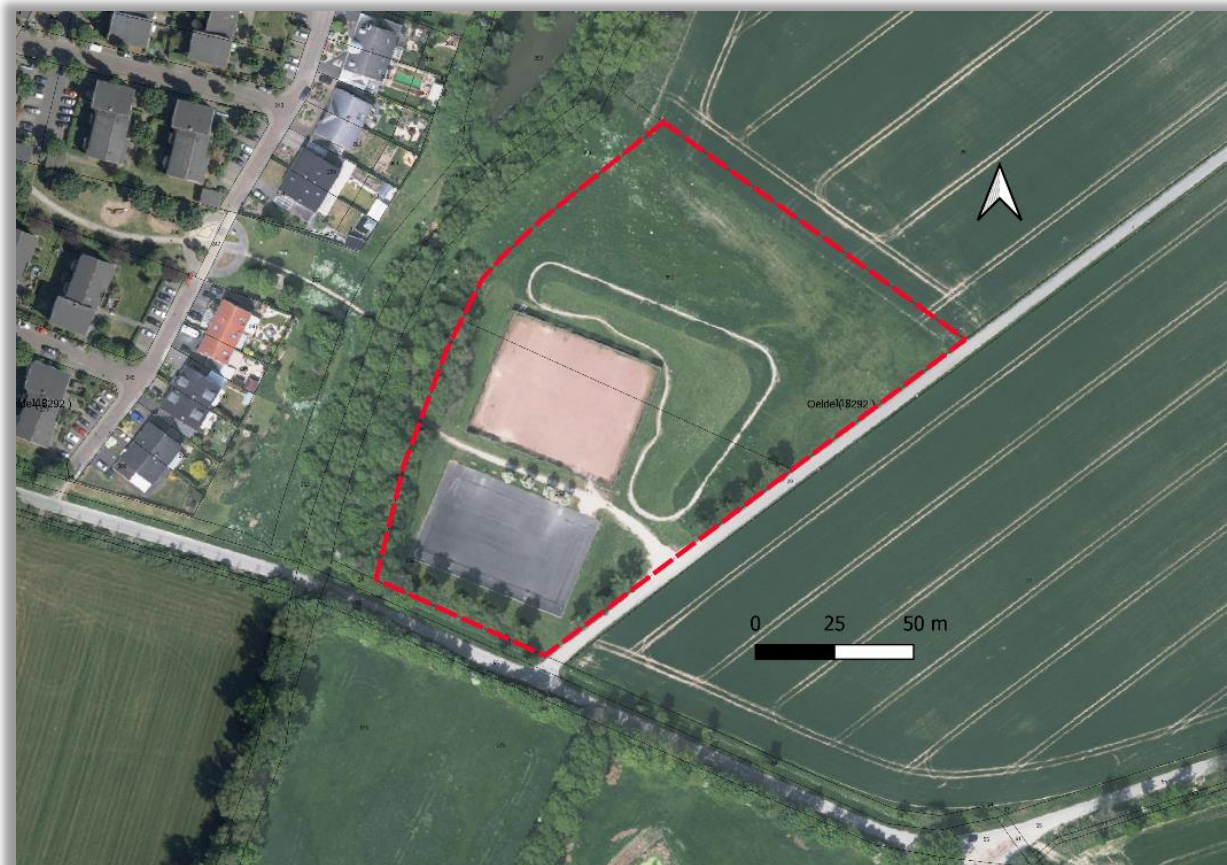
Abbildung 3: Aktuelle Nutzung im Geltungsbereich (Luftbild, unmaßstäblich, Geltungsbereich rot umrandet)

Südlich an den Planbereich angrenzend befinden sich ein Grünstreifen und anschließend der Bergelerweg auf dessen Südseite Intensivgrünland liegt. Östlich grenzt die Fläche an den Weitkampweg und jenseits dessen an Ackerfläche. Ackerfläche begrenzt den Geltungsbereich auch im Norden. Im Westen trennt der Bergeler Bach mit seinen ihn begleitenden Gehölzen den Geltungsbereich und die benachbarte Siedlung. Nordwestlich liegt nahe der Planungsfläche ein mit Gehölzen umstandenes Regenrückhaltebecken jenseits des Bergeler Baches.