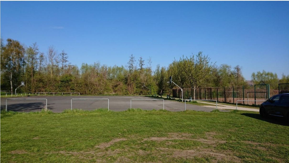
Foto 1: Rasen, Basketballplatz. Im Hintergrund die den Bergeler Bach begleitenden Gehölze (Blick nach Westen)