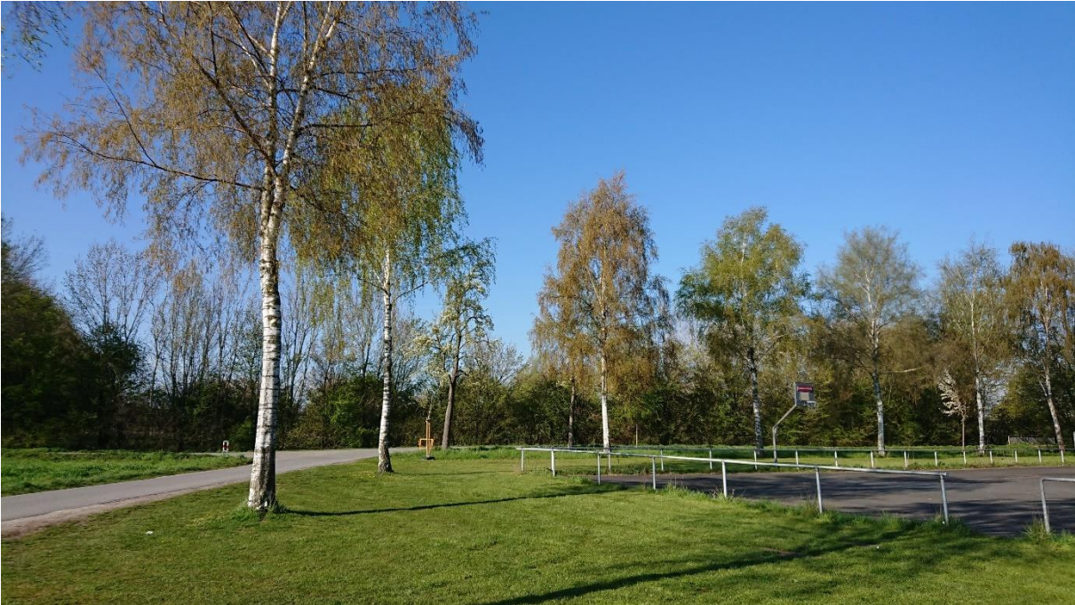
Foto 3: Birkenreihe am Ost und Südrand, auf Rasenfläche (Blick nach Süden)