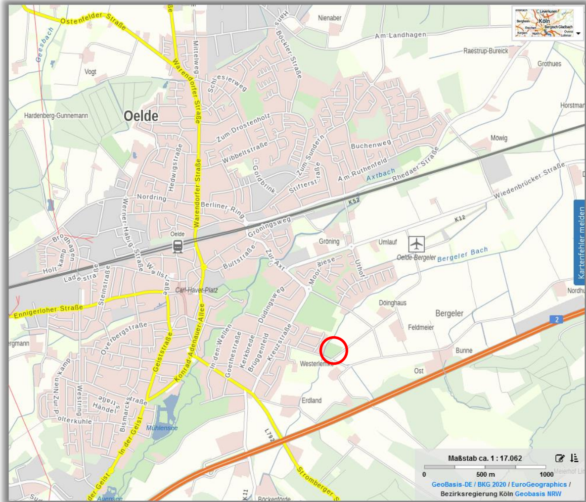
Abbildung 1: Lage des Geltungsbereiches der 40. FNP-Änderung und des BP Nr. 148 (unmaßstäblich, Geltungsbereich rot umrandet)