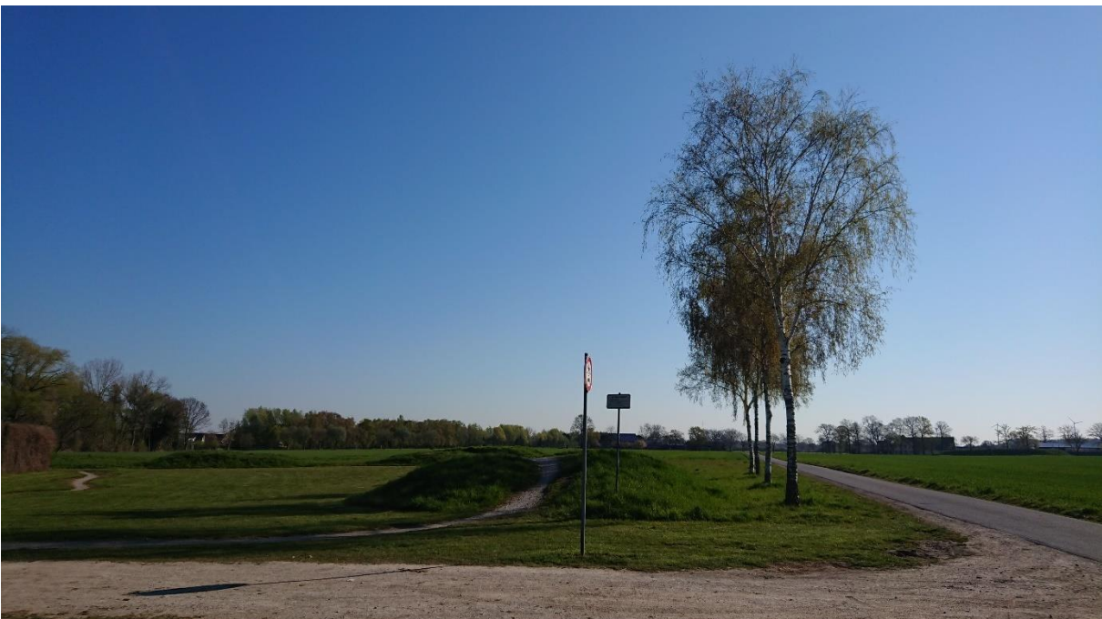
Foto 2: Mountainbikestrecke auf Rasen, Birken am Weitkampweg (Blick nach Norden)