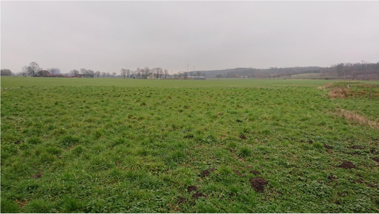
Foto 5: Grünstreifen zwischen Gehölzen am Bergeler Bach und Bolzplatz (Blick nach Norden)