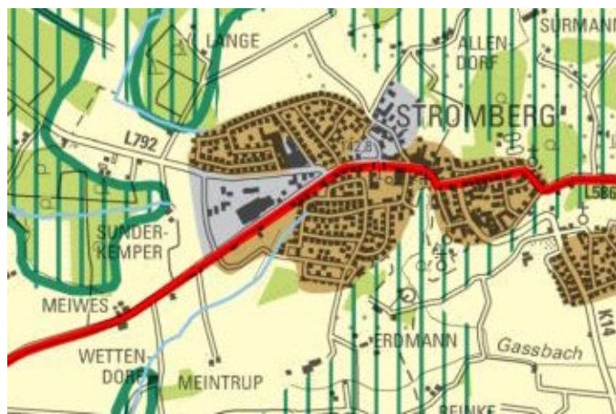
Abbildung 1: Auszug aus dem Regionalplan Münsterland

Laut des Regionalplans Münsterland 1 liegen die Flächen in dem „Bereich für gewerbliche und industrielle Nutzungen (GIB)“, die geplante Bauleitplanung ist somit aus regionalplanerischer Sicht mit den zeichnerischen Zielen der Raumordnung vereinbar. Die Zielsetzung des Regionalplans liegt auf der bedarfsgerechten, freiraum- und umweltverträglichen Siedlungsentwicklung unter Berücksichtigung des Vorrangs der Innen- vor der Außenentwicklung.