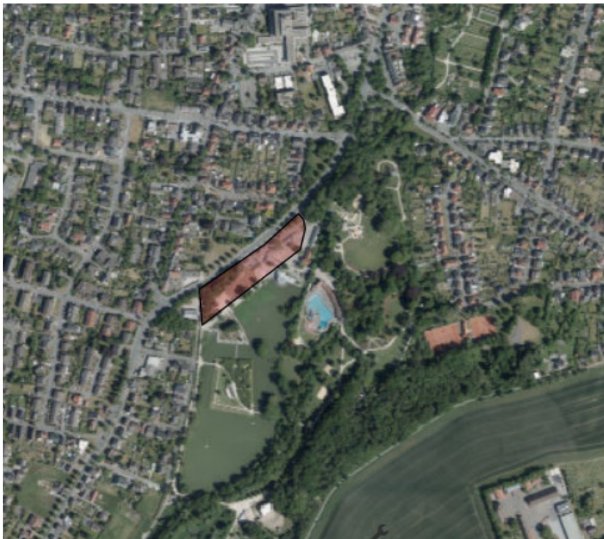
Abbildung 1: Lage des Plangebietes im Süd-Osten von Oelde

Im aktuell rechtskräftigen Flächennutzungsplan ist die Fläche des Geltungsbereichs zum Teil bereits als „Öffentliche Grünfläche“ und zum Teil als „Sonderbaufläche – S 2 Hotel“ dargestellt.