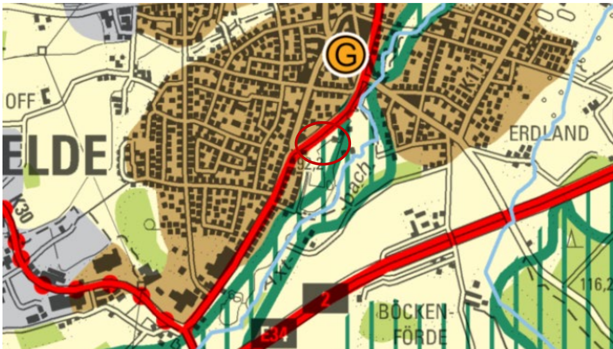
Abbildung 2: Auszug aus dem Regionalplan Münsterland

Im Regionalplan Münsterland ist der Planbereich als „Allgemeiner Freiraum und Agrarbereich (AFAB)“ festgelegt und schließt getrennt von der Bestandsstraße Konrad-Adenauer-Allee an einen „Allgemeinen Siedlungsbereich (ASB)“ an. Die Zielsetzung des Regionalplans liegt auf der bedarfsgerechten, freiraum- und umweltverträglichen Siedlungsentwicklung unter Berücksichtigung des Vorrangs der Innen- vor der Außenentwicklung.