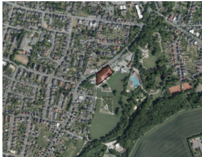
Abbildung 1: Luftbild Plangebiet im Südosten von Oelde

Nördlich wird das Plangebiet durch die Straße „Konrad-Adenauer-Allee“ begrenzt. Im Osten grenzt vorrangig der Vier-Jahreszeiten-Park mit dem Mühlensee im Süden an. Im Westen schließt sich das vorhandene Betriebsgelände des Gärtnerbetriebs mit einer vorhandenen Halle an.