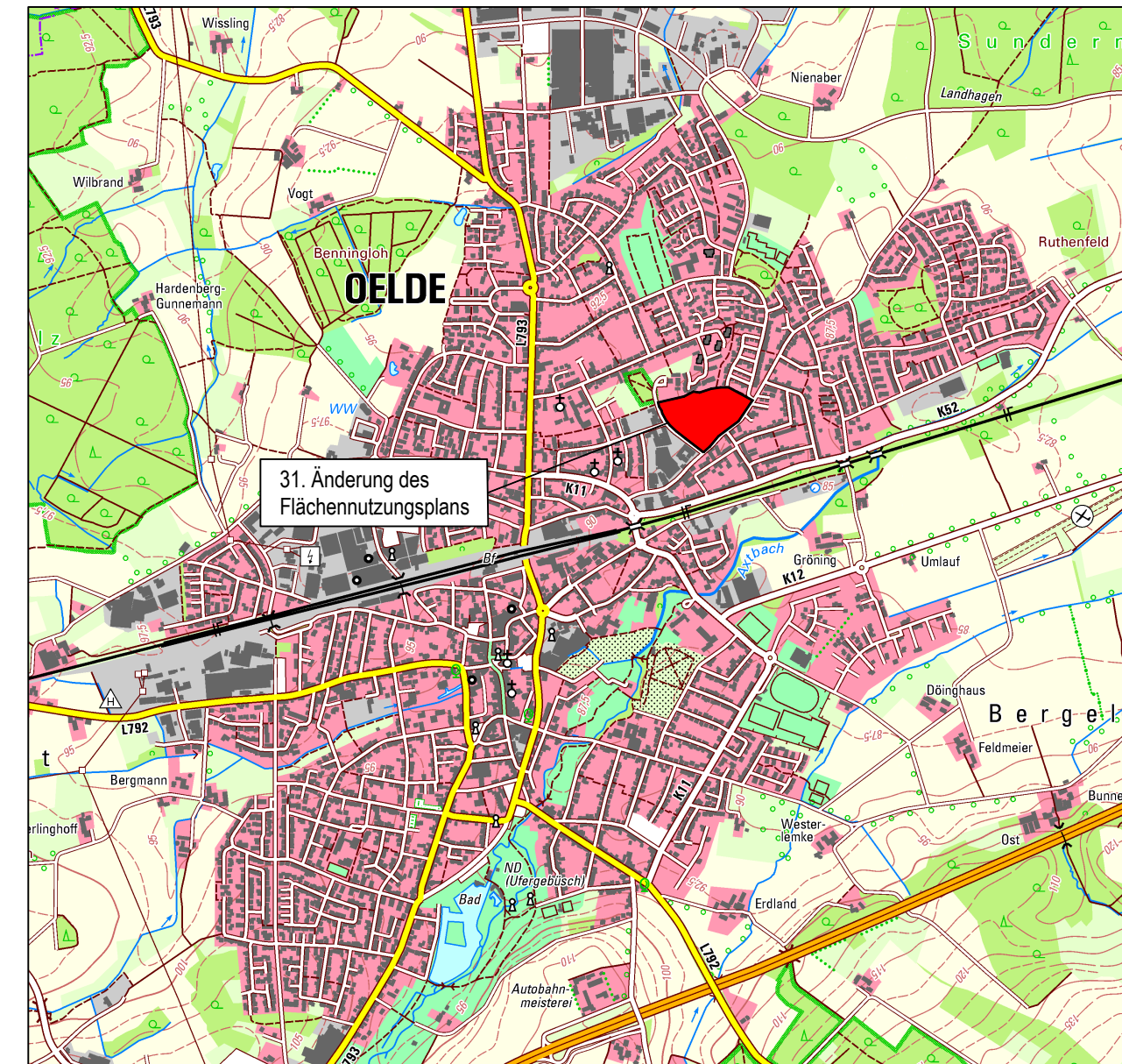
ÜBERSICHTSPLAN © Geobasisdaten: Land NRW, Bonn und Kreis Warendorf