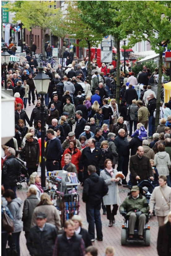
Frühlingserlebnistag Sonntag, 03. April 2022