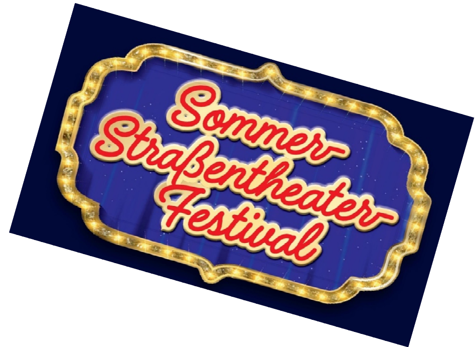
Straßentheater-Festival in der Oelder Innenstadt Samstag, 21. Mai 2022 Sonntag, 22. Mai 2022