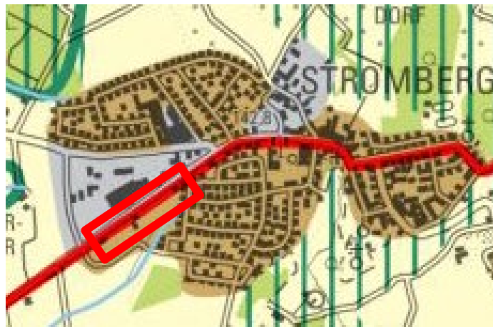
Abbildung 3: Auszug aus dem Regionalplan Münsterland

Zunächst wurden die Flächen südlich der Beckumer Straße betrachtet, welche im Regionalplan als „Allgemeiner Siedlungsbereich (ASB)“ dargestellt ist. Da eine Zufahrt über die Beckumer Straße nicht in Aussicht gestellt werden kann, ist hier eine anderweitige Zufahrt zu planen. Des Weiteren schließen diese Flächen unmittelbar an die vorhandenen Bebauungspläne Stromberg Nr. 6 „Upn Dauden“ und Nr. 100 „Stromberg – Südlich der Beckumer Straße“ an, und somit an vorhandene Wohn- und Mischgebiete an. Dies ist aus immissionsschutztechnischer Sicht kritisch zu betrachten.