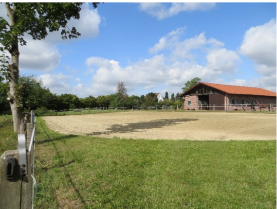
Reithalle und Paddock östlich des Plangebietes