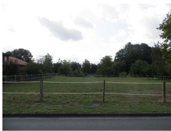
Wiesenfläche Blick von Norden