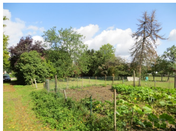
Hausgarten – Blick von Süden