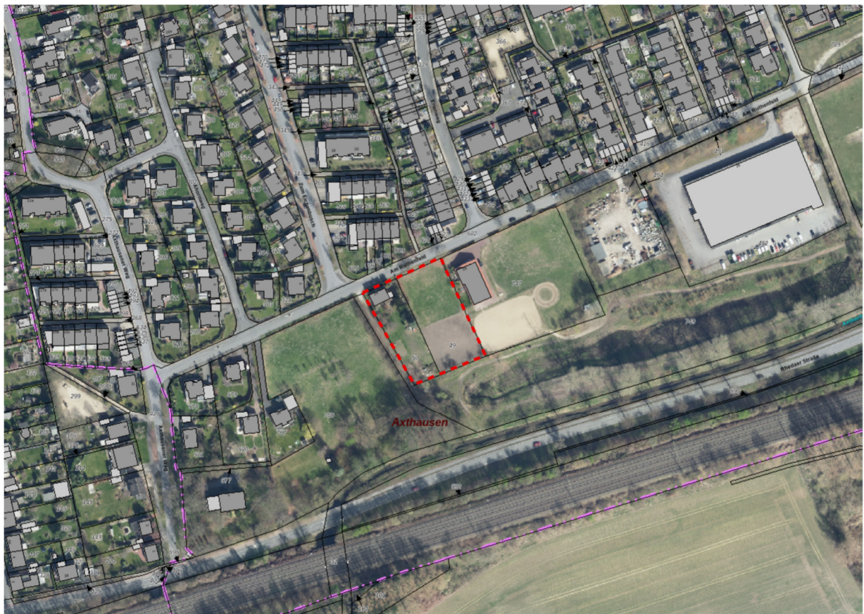
Abb. 3: Luftbildkarte mit Plangebiet

Bei der Begehung im August 2019 befand sich auf der Pferdeweide im östlichen Teil des Plangebietes eine Gruppe von fünf Dohlen. Außerhalb des Plangebietes wurden Wiesenschafstelzen und Bachstelzen beobachtet. In weiterer Entfernung (im Umfeld des weiter östlich gelegenen Reitplatzes) wurde eine Rauchschnalbe gesichtet. Diese sollen (nach Auskunft einer Reiterin) auch in dem östlich unmittelbar angrenzenden Stall brüten. An dem Pferdestall und an dem Bestandsgebäude im Plangebiet befanden sich jedoch keine Nester von Mehlschnalben.