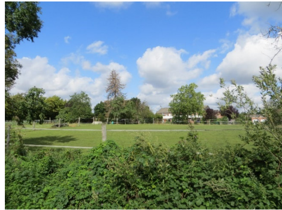
Wiesen- und Gartenfläche Blick von Südosten