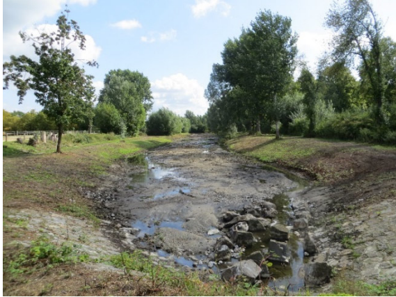
Südlich angrenzendes Regenrückhaltebecken