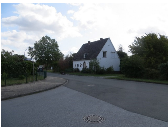
Wohnhaus "Am Ruthenfeld" Nr. 24