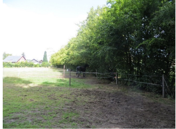
Hainbuchen-Hecke westlich der Wegeparzelle