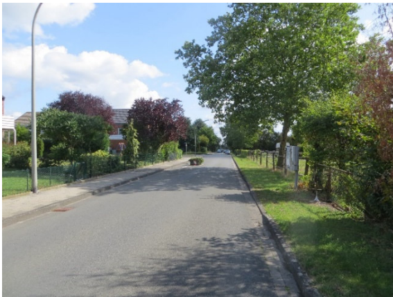
Straßenansicht „Am Ruthenfeld“ mit Platane