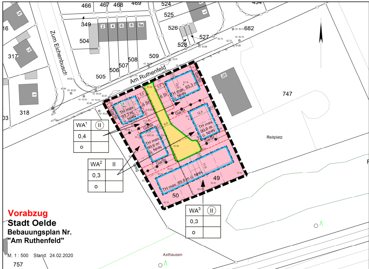
Abb. 1: Bebauungsplan-Entwurf

Ziel der Aufstellung des Bebauungsplanes "Am Ruthenfeld" in Oelde ist die Schaffung der planungsrechtlichen Voraussetzung für eine Fortsetzung vorhandener Wohnbebauung nach Süden. Auf einer ca. 0,4 ha großen, als Garten und Grünland genutzten Fläche (Flurstücke 49 und 50) sollen ca. 10 Baugrundstücke entwickelt werden.