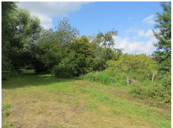
Saum- und Gebüschstruktur am Südrand des Plangebietes