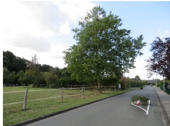
Straßenansicht „Am Ruthenfeld“ mit Platane