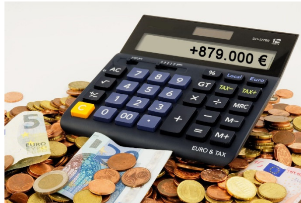
Haushalt des Jugendwerks Zum 31.12. eines Jahres

Nur im Sicherungsfall für die Zahlung von Gehältern