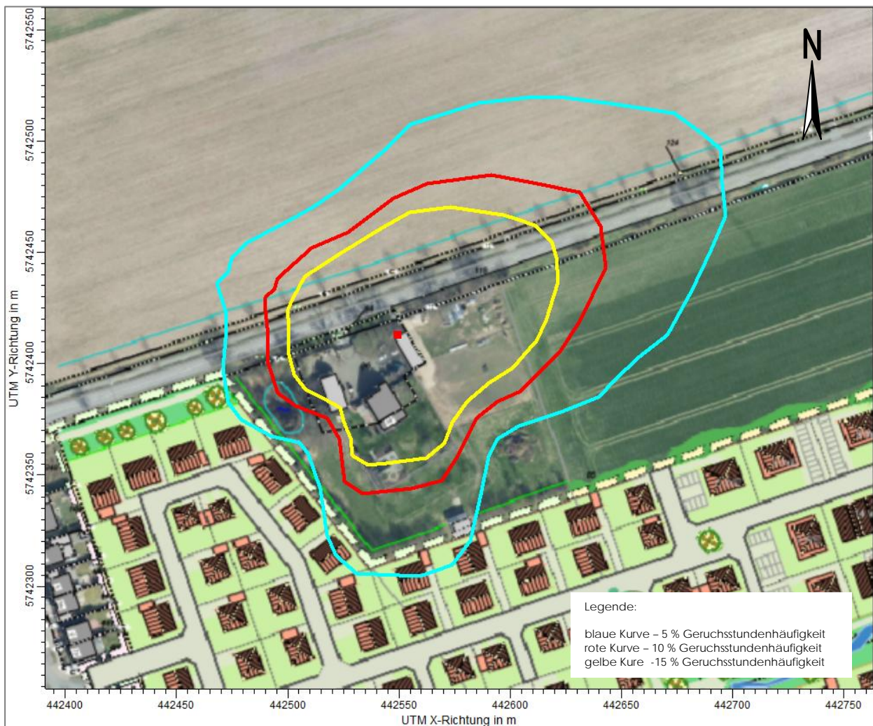
Abbildung 4: Richtlinienabstände nach VDI 3894-2 für Geruchsstundenhäufigkeiten von 5 % (Blau), 10 % (Rot) und 15 % (Gelb)

Der Richtlinienabstand, der den Mindestabstand zwischen dem Emissionsschwerpunkt der Tierhaltungsanlage und dem Plangebiet zur Einhaltung des Immissionswertes für Wohn-/Mischgebiete (0,10) definiert, beträgt unter Berücksichtigung der ermittelten Emissionen der Tierhaltungsanlage von 81 GE/s ca. 40 m bzw. 75 m. Der reale Abstand zwischen dem Emissionsschwerpunkt der Tierhaltungsanlagen und dem Plangebiet beträgt ca. 70 bzw. 90 m.