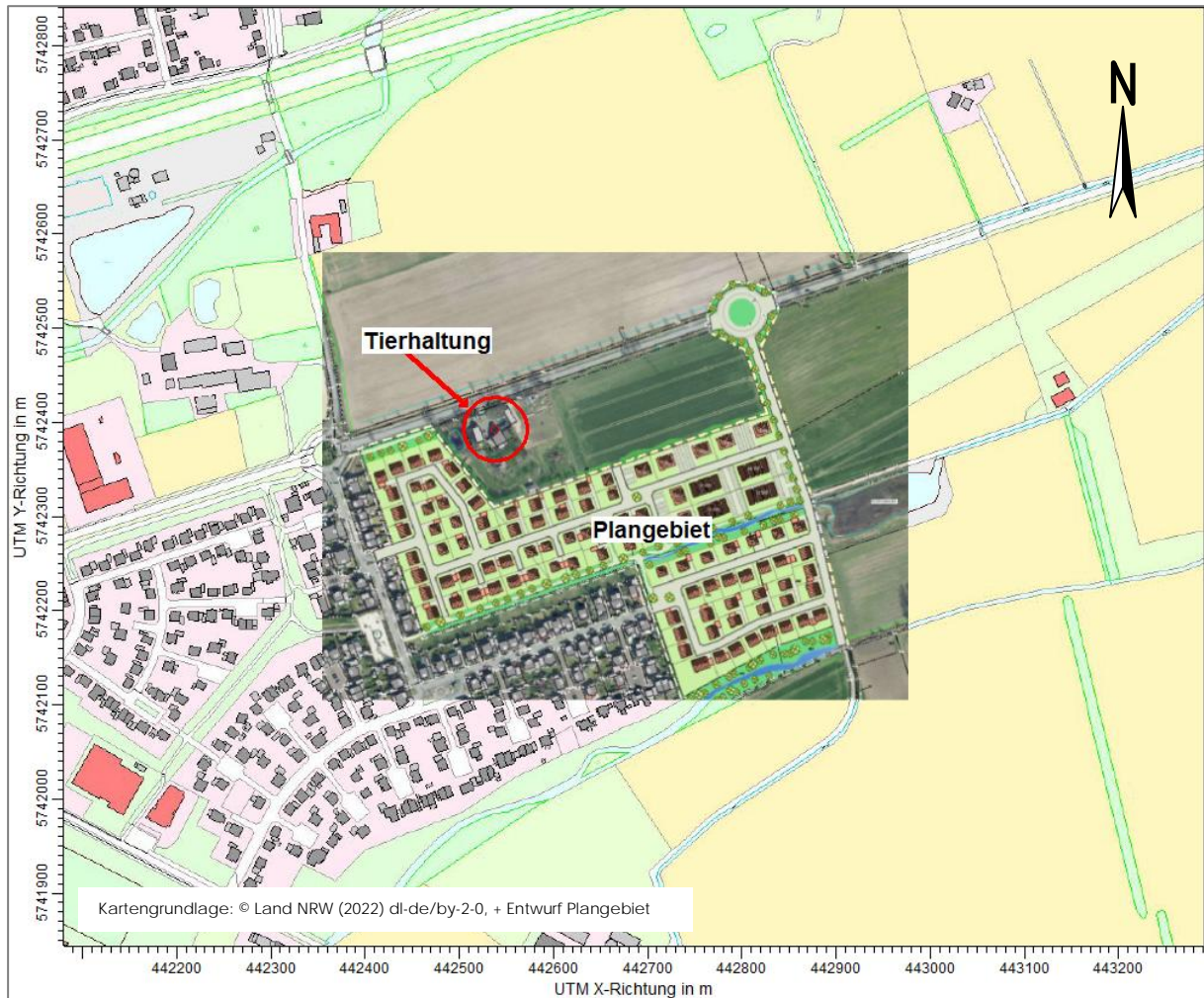
Abbildung 1: Lage des Plangebietes und des Tierhaltungsbetriebes

Die folgende Abbildung zeigt die Lage des Plangebietes und des Tierhaltungsbetriebes: