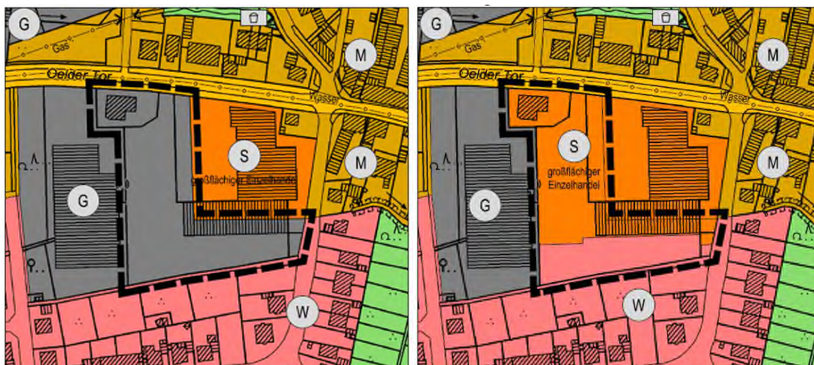
Abbildung 2: Flächennutzungsplan der Stadt Oelde, vorher/nachher Darstellung Auszug ohne Maßstab

Der Flächennutzungsplan der Stadt Oelde stellt für den Planbereich Sondergebiet „großflächiger Einzelhandel“ und Gewerbliche Bauflächen dar. Die geplanten Festsetzungen des Bebauungsplanes Nr. 160 können nicht gemäß § 8 (2) BauGB aus diesen Darstellungen entwickelt werden, da die Darstellung gewerblicher Bauflächen der geplanten Entwicklung entgegensteht. Daher wird der Flächennutzungsplan im Parallelverfahren gemäß § 8 (3) BauGB geändert. Im Rahmen der parallelen 50. Änderung des Flächennutzungsplanes werden die gewerblichen Bauflächen zugunsten einer Ausweitung der Sonderbauflächen und einer Darstellung von Wohnbauflächen zurückgenommen. Mit der parallelen Änderung des Flächennutzungsplanes wird dem Entwicklungsgebot gemäß § 8 (2) BauGB entsprochen.