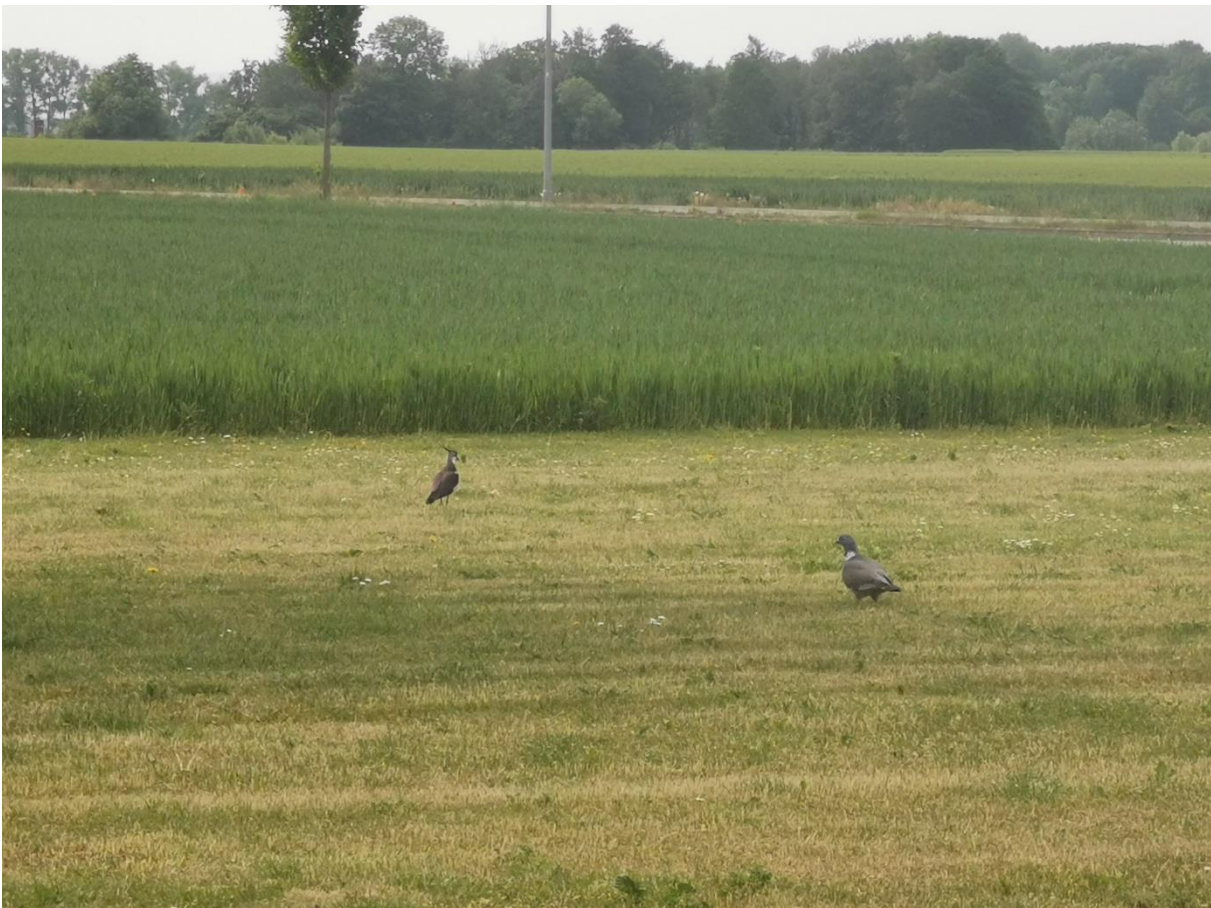
Foto 6: Kiebitz bei Nahrungssuche auf dem Betriebsgelände – Omnibusbetrieb Willebrand