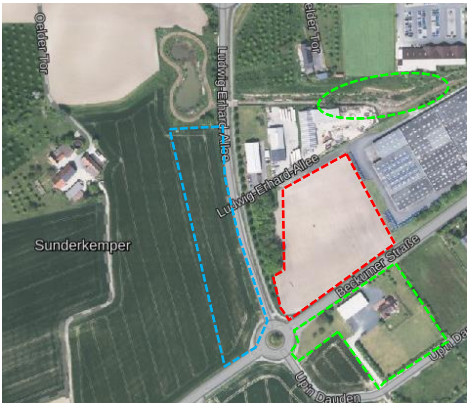
Abbildung 3: Brutkolonie des Kiebitz und Nahrungsräume

Der Planbereich selbst wird weder als Fortpflanzungs- und Ruhestätte noch als erweitertes Nahrungshabitat von der Kiebitzpopulation genutzt. Es konnten bei den Begehungen keine funktionellen Beziehungen festgestellt werden. Ob dennoch die Realisierung der Planungen die Kiebitzpopulation einschränken (ggf. optische Bedrängung) wird in einer Art-für-Art-Prüfung der Stufe II dargestellt. Die Beobachtung weiterer planungsrelevanter Offenlandarten wie z. B. Feldlerche, Rebhuhn gelang nicht.