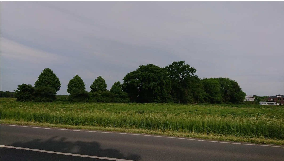
Foto 4: Baumreihe / Feldgehölz zwischen Planbereich und Brutstätten