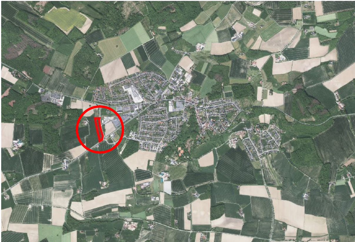
Abbildung 1: Lage des Plangebiets