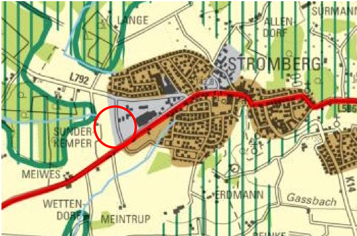
Abbildung 2: Auszug aus dem Regionalplan Münsterland

Laut des Regionalplans Münsterland 1 liegen die Flächen in dem „Bereich für gewerbliche und industrielle Nutzungen (GIB)“, die geplante Bauleitplanung ist somit aus regionalplanerischer Sicht mit den zeichnerischen Zielen der Raumordnung vereinbar. Die Zielsetzung des Regionalplans liegt auf der bedarfsgerechten, freiraum- und umweltverträglichen Siedlungsentwicklung unter Berücksichtigung des Vorrangs der Innen- vor der Außenentwicklung.