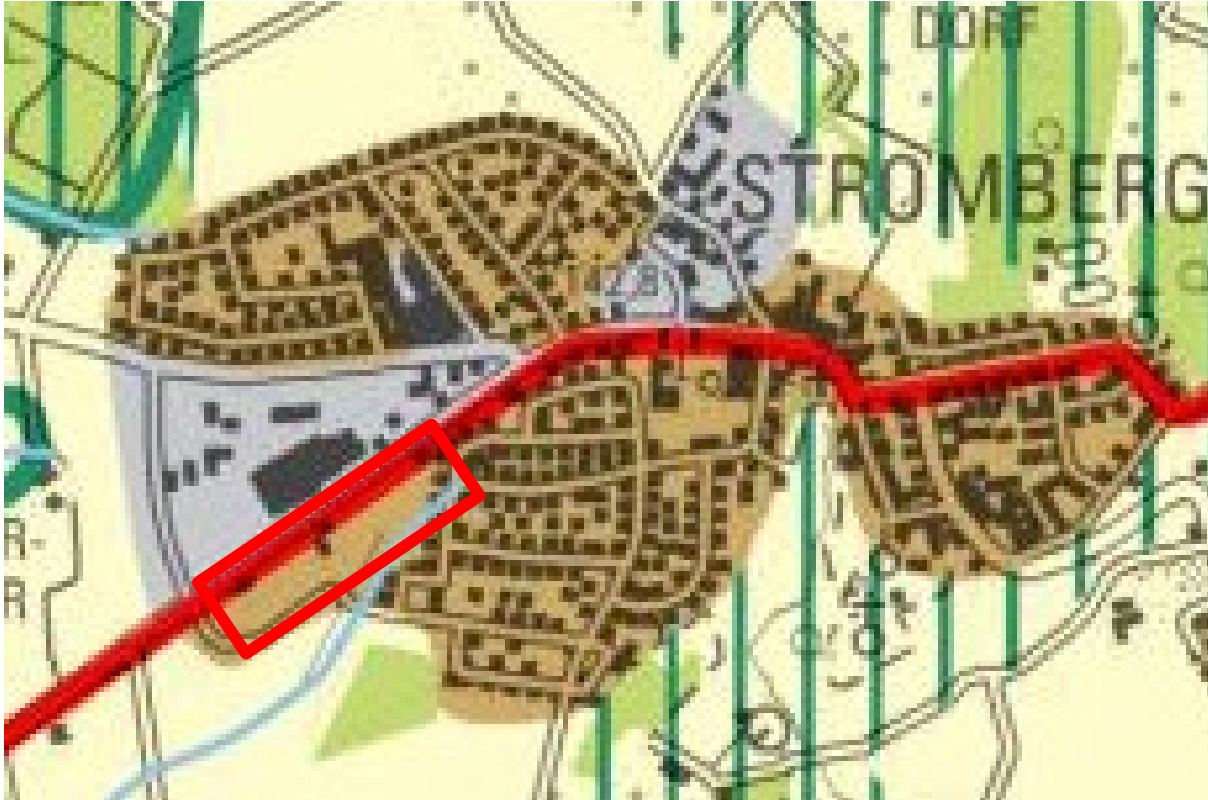
Abbildung 3: Auszug aus dem Regionalplan Münsterland

somit an vorhandene Wohn- und Mischgebiete an. Dies ist aus immissionsschutztechnischer Sicht kritisch zu betrachten.