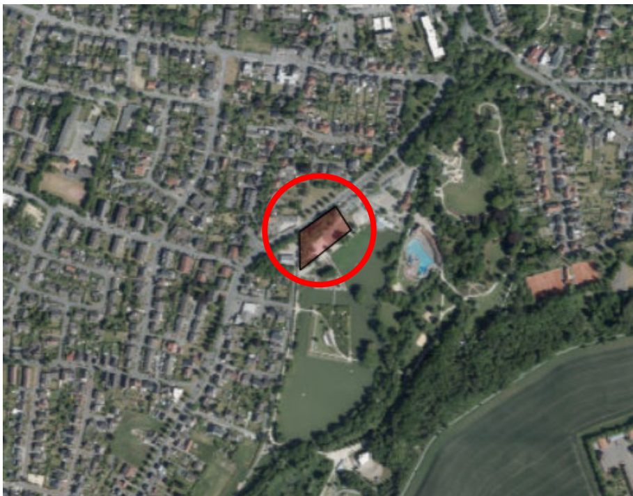
Abbildung 1: Lage des Plangebietes im Süd-Osten von Oelde

Im aktuell rechtskräftigen Flächennutzungsplan ist die Fläche des Geltungsbereichs zum Teil bereits als „Öffentliche Grünfläche“ und zum Teil als „Sonderbaufläche – S 2 Hotel“ dargestellt.