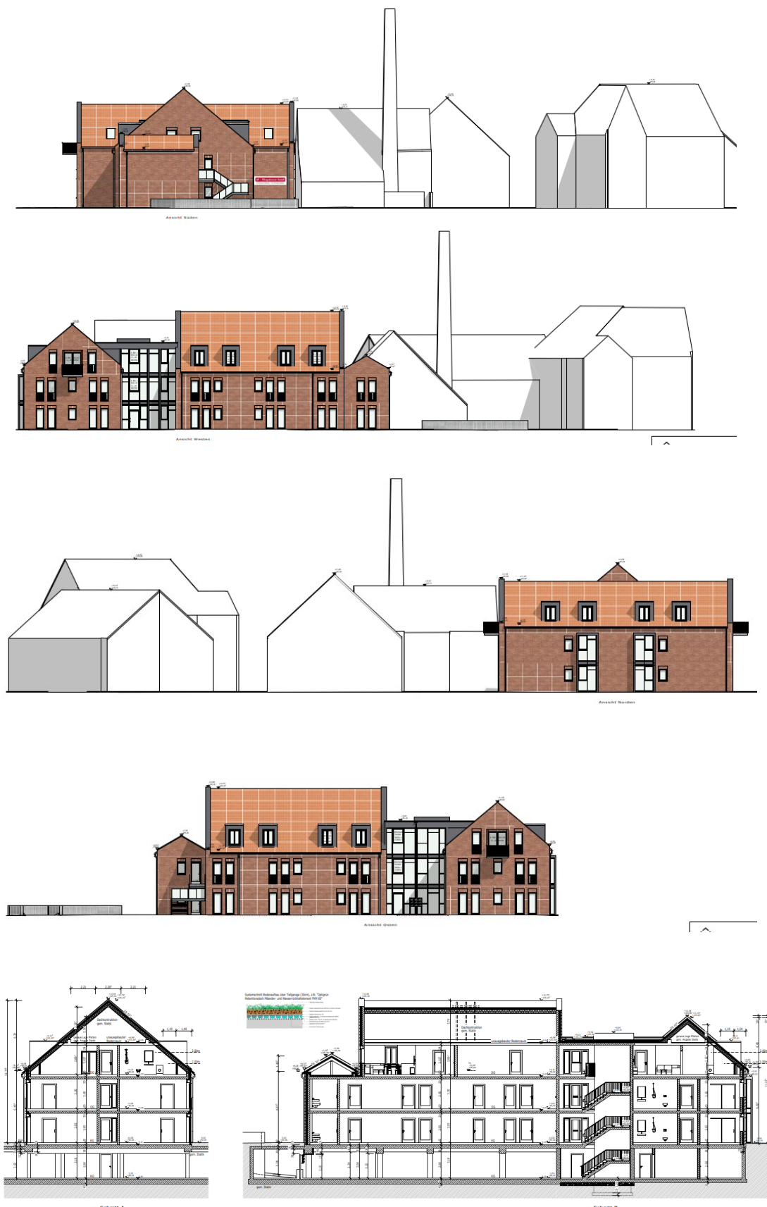
Abb. 2: Vorhaben- und Erschließungsplan zum vorhabenbezogenen Bebauungsplan Nr. 157 „Ehemalige Brennerei Horstmann“, hier: Ansichten und Schnitte (Stand März 2023, verkleinert, ohne Maßstab, Quelle: Altefrohe Planungsgesellschaft mbH) – Der Originalplan ist bei der Stadt Oelde, Fachdienst Stadtentwicklung, Planung, Bauordnung einsehbar.