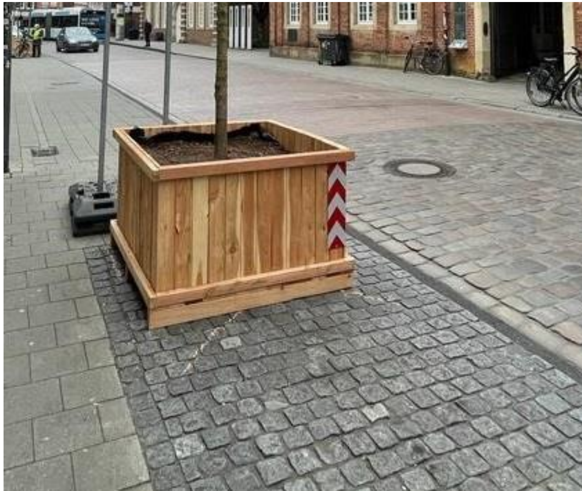
Blumengefäße aus Lärchenholz