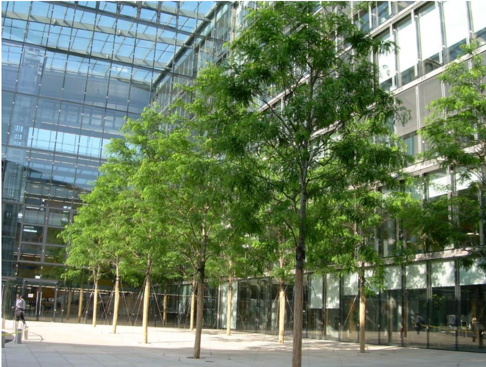
Gleditsia triacanthos ‚Skyline‘