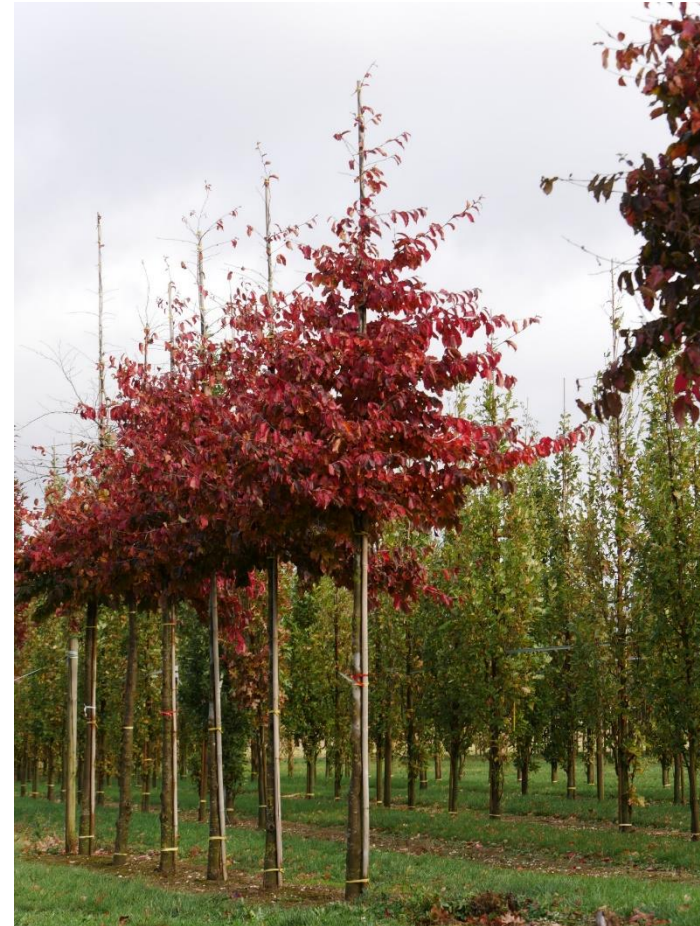
Parrotia persica (Eisenholzbaum)