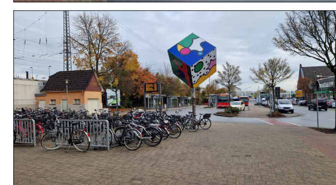
Fotomontage für beidseitige FÜD