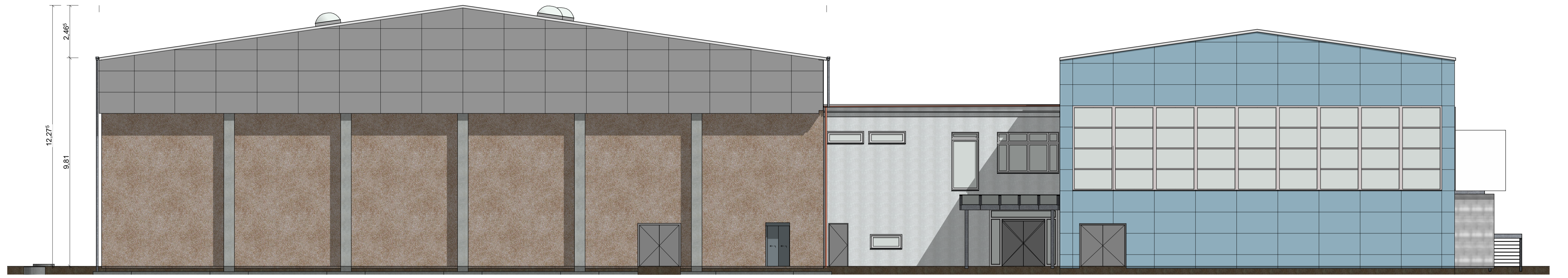
A-02 Ansicht Süd 1:100