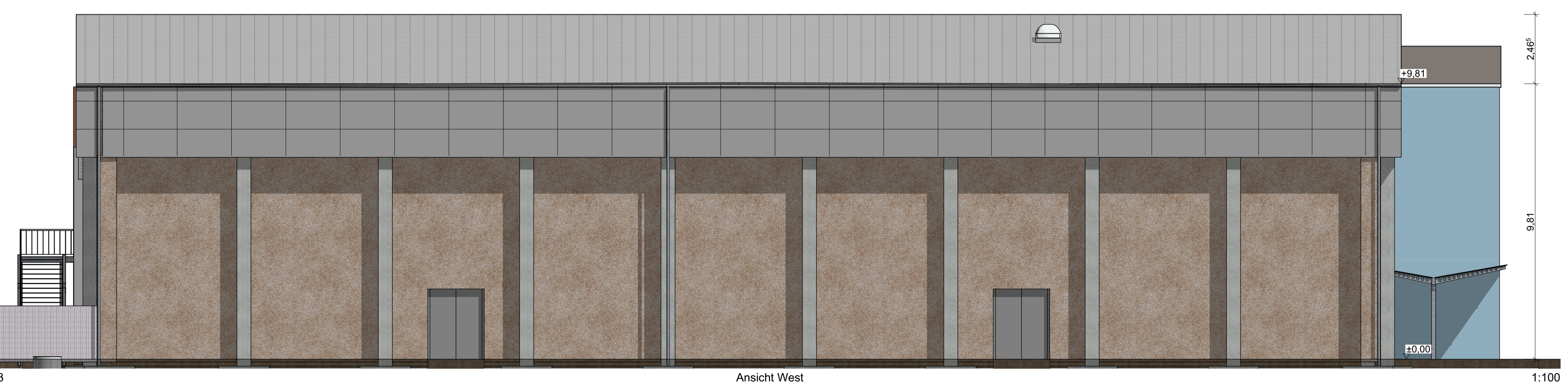
A-03 Ansicht West 1:100