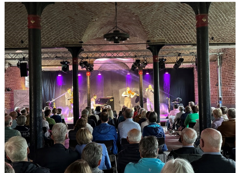
Hanke Brothers Haus Geist