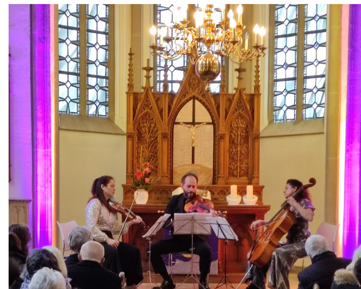
Klassische Musik zum Bachfest