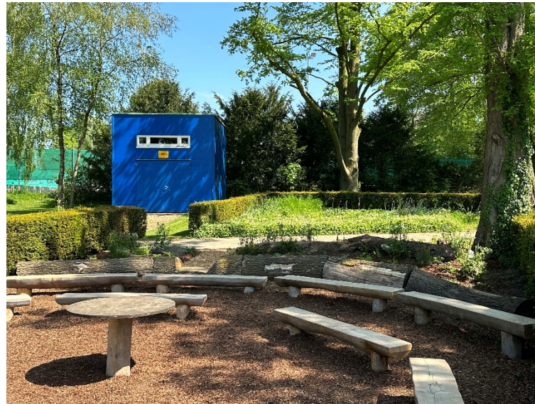
Outdoorkurse Kindergeburtstage und Lernort